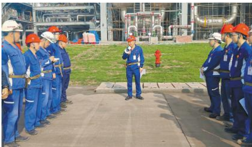
永祥能源科技开展项目现场大检查

工作会上,李总表示,二期作为晶硅行业最大的单体项目,云南团队责任重大。在各项数据指标背后,看到了大家上半年的努力,成绩可喜可贺。希望云南团队继续围绕“安全是所有工作的前提”,做好现场管理,以阳光、积极、正能量的团队风貌稳定运行一期生产,高效建设二期项目。杜总表示,云南通威将遵照刘汉元主席对晶硅项目的指示要求,坚决执行“高效经营,执行到位”的经营管理思路,全面落实“安全稳定,改善提升,团队建设”三大主题工作,拿出铁军的气魄,发挥团队所有人的聪明才智,以严谨、务实的态度,继续围绕安全、质量、效率全面发力,朝着确保一期安全稳定高效生产,全力铸造二期精品工程的目标砥砺前行。