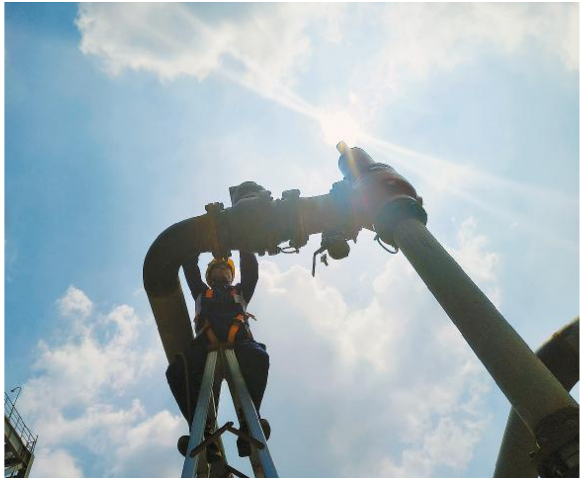
炎暑烈日下的奋斗者