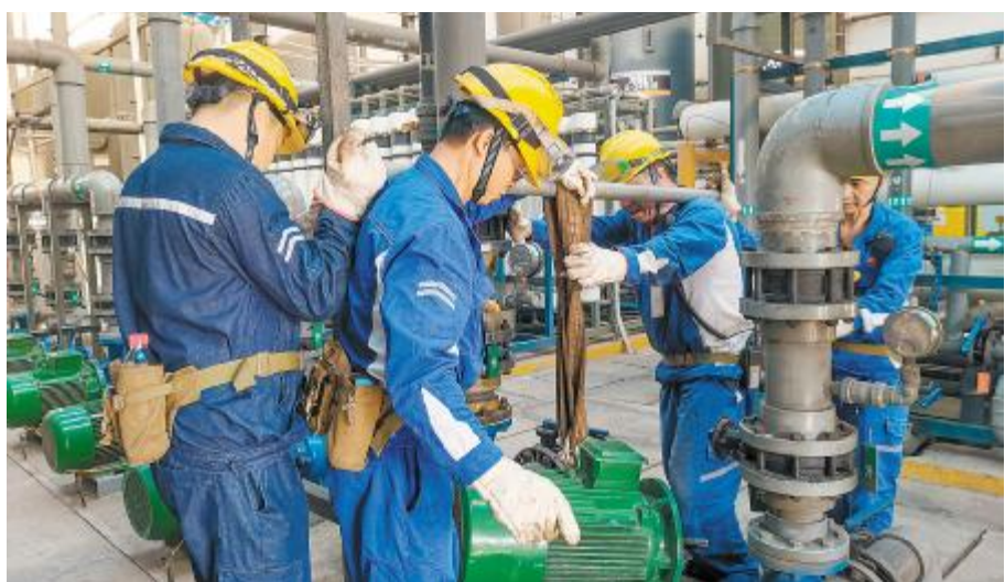
电工班组搬运电机进行安装