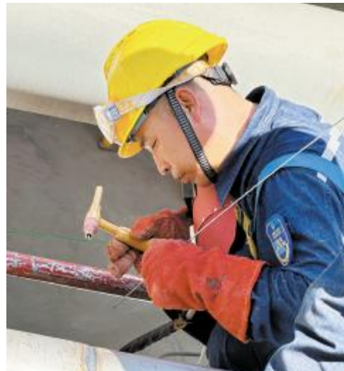
设备动力部开展检修工作