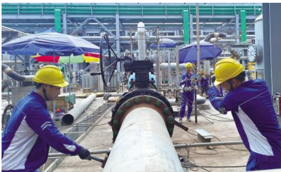
坚守一线岗位,直面“烤”验的永祥人