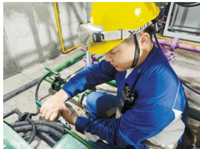
电气段员工对设备进行检查