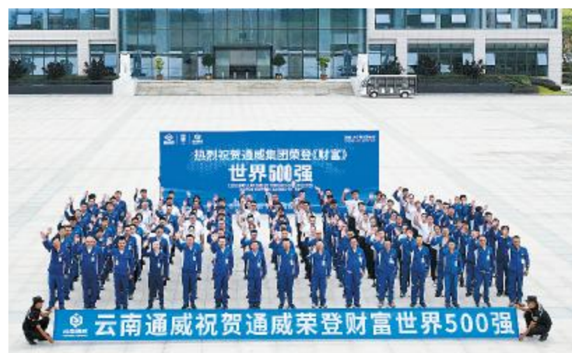
乘势而上 再攀高峰

实现营收740.68亿元,同比增长22.75%;实现归属于上市公司股东净利润132.70亿元,同比增长8.56%。在高纯晶硅业务方面,公司深入推进提质增效、管理降本,实现各基地持续安全稳定且满负荷运行,核心消耗指标继续优化,以品质提升和成本优势续写增势;实现高纯晶硅销量17.77万吨,同比增长64%,国内市占率超过30%左右,目前生产成本降至4万元/吨以内。随着下游N型技术