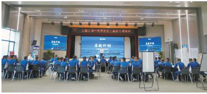
永祥股份工段长“启航计划”第一阶段培训结业仪式现场