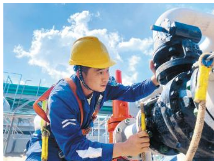
不惧“烤”验的永祥人