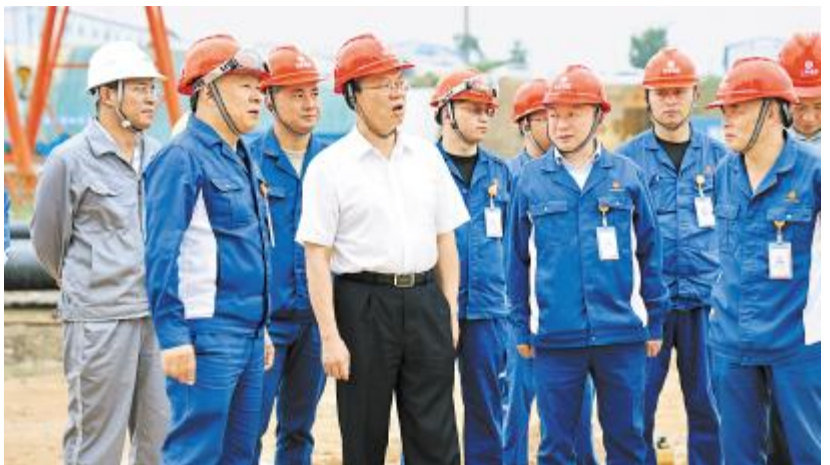
保山市委书记杨军莅临云南通威二期项目建设现场调研

康院士对永祥绿色高质量发展给予高度评价,并表示,永祥始终坚持自主研发,推动了国内多晶硅生产工艺的不断优化和完善,在技术、成本、质量、规模上不断赶超欧美,实现全球领先。希望永祥继续加强技术研发投