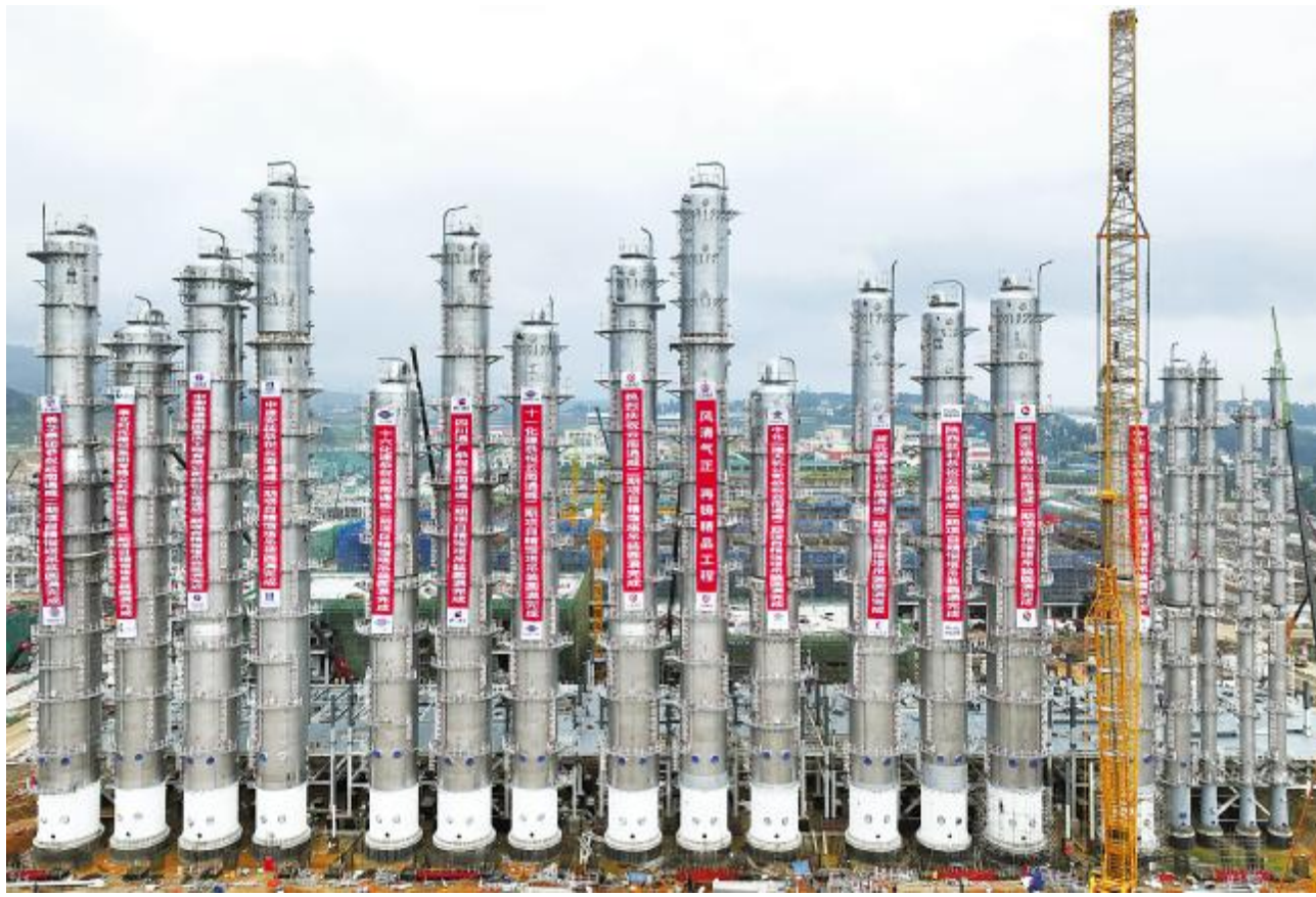
云南通威二期项目精馏塔吊装完成

据通威股份 2023 半年报显示,上半年,永祥各生产基地均满负荷运行,实现高纯晶硅销量 17.77 万吨 ,同比增长 64% ,国内市占率达到 30% 左右。目前生产成本已降至 4 万元/吨 以内,N型高纯晶硅产品销量同比增长 447% 。目前,公司高纯晶硅现有产能超 42 万吨 。