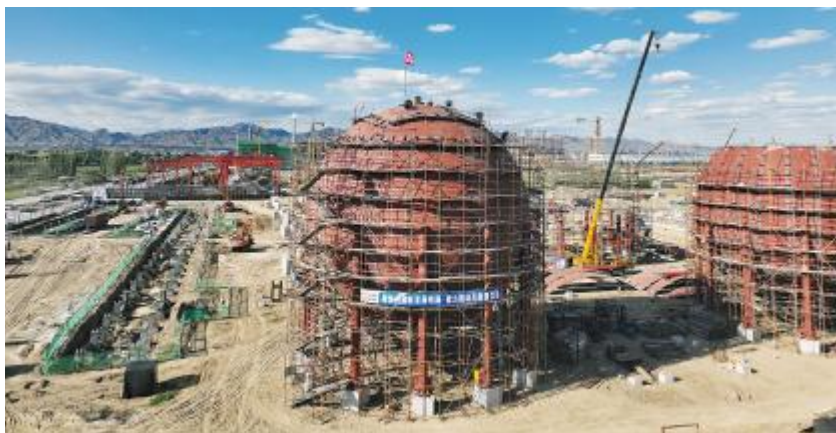
内蒙古通威硅能源第一台设备 4000m 3 球罐顺利安装完成