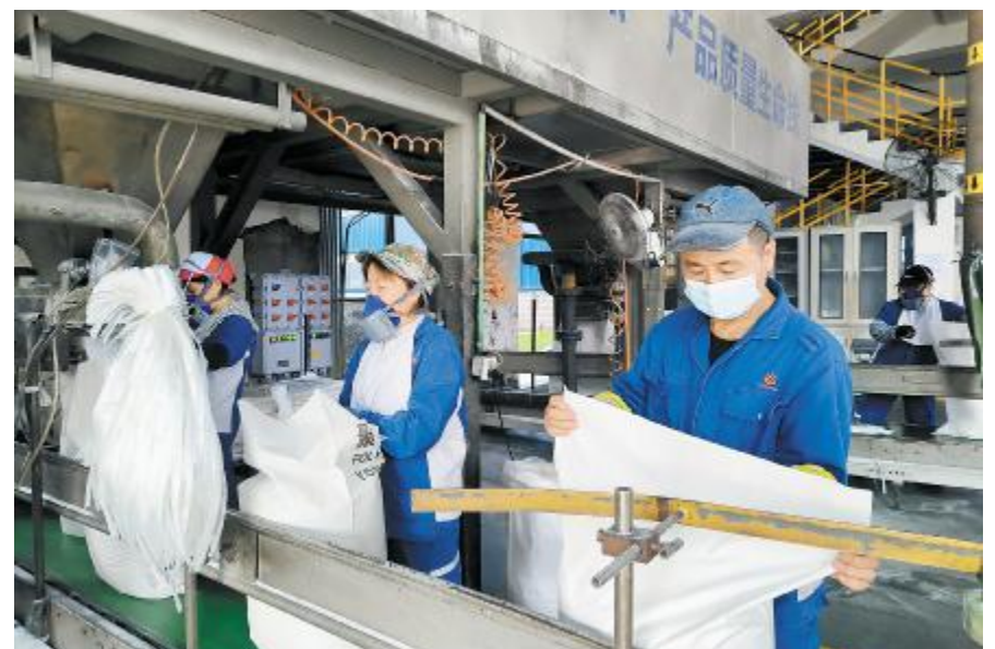
高温下骁勇“蒸”战的劳动者