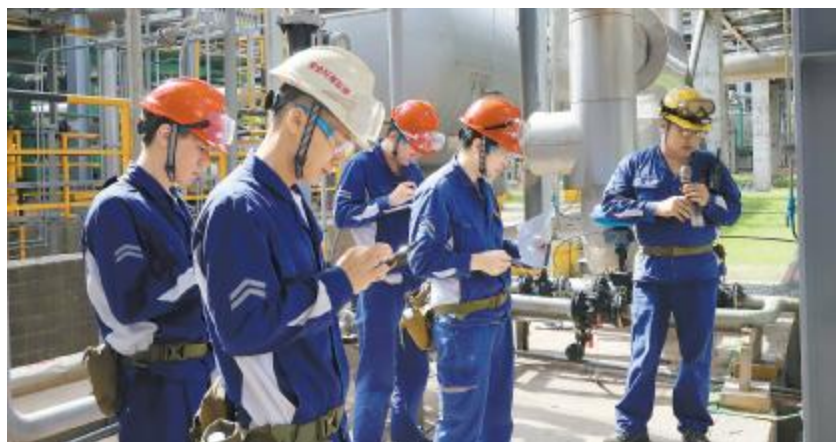
永祥多晶硅开展现场 JCC 检查

项目开工以来,内蒙古通威硅能源各专业组协同配合,补齐短板,高效有序推进工作,严格按照节点建设,重点关注影响进度的事项,以时不我待的紧迫感和舍我其谁的责任感,共同谱写新蓝图。