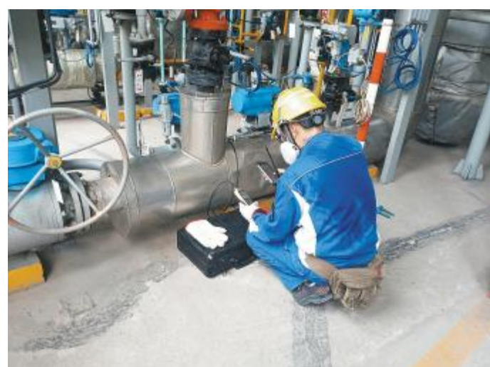
巡检工作人员按清单检测露点