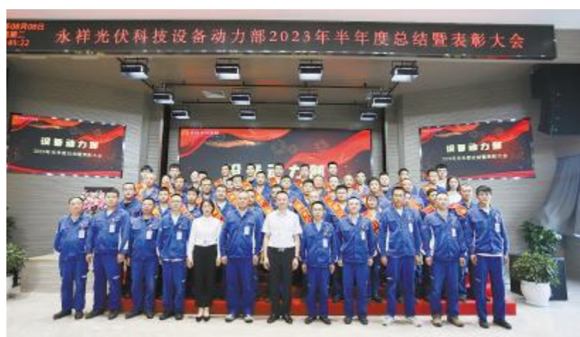
永祥光伏科技设备动力部 2023 半年度总结暨表彰大会现场

内蒙古通威硅能源开工建设以来,建设团队深刻理解“高效经营、执行到位”的经营管理思路,遵照“工艺先进、装备精良、安全高效、造价合理、工匠施工、团队匹配”的精品工程建设理念,不断增强经验转化能力和技术创新能力,聚焦“安全、质量、进度”关键点,把打造精品工程落到实处。