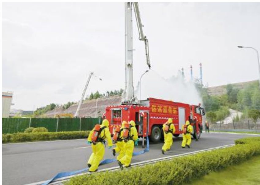
永祥新能源开展重大危险源事故专项应急演练

不扣地抓好每个环节的安全管理;依托信息化、自动化布局,优化升级现有系统,减少人工操作带来的潜在错误,进一步提高管理效率与工作准确性;要以永祥股份“高效经营、执行到位”经营管理思路为指引,科学组织施工,严格质量监管,加强要素保障,立足全局打造精品工程。