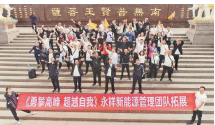
永祥新能源举行管理团队拓展活动