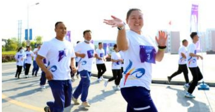
内蒙古通威举行通威40年庆追光健康跑活动