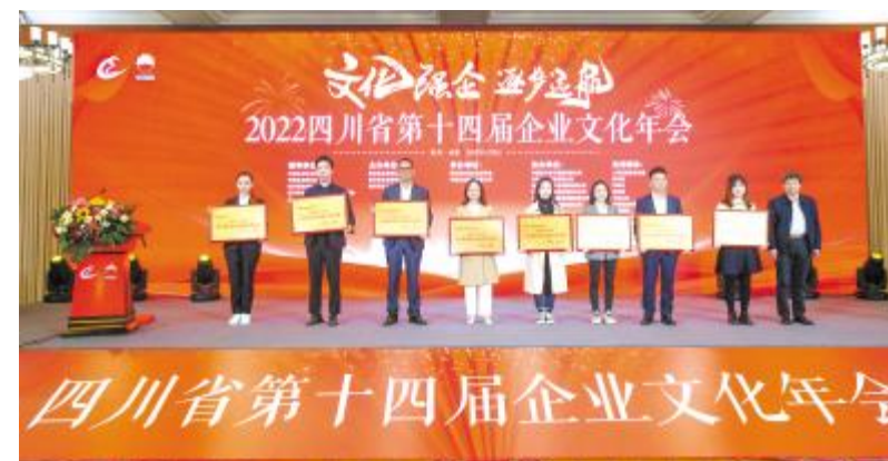
永祥股份荣获“四川省企业文化建设先进单位”称号