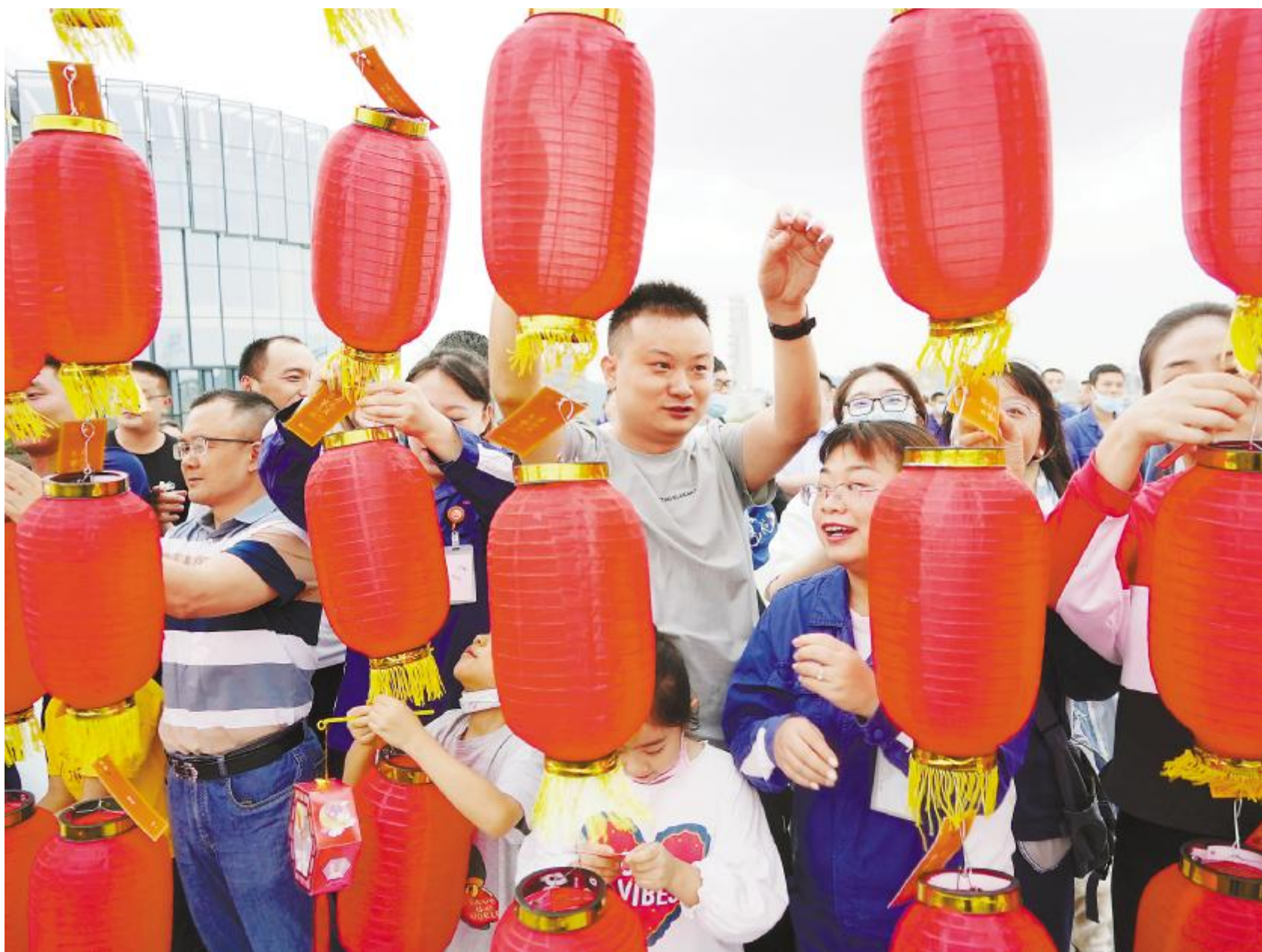
欢聚一堂,共度中秋佳节