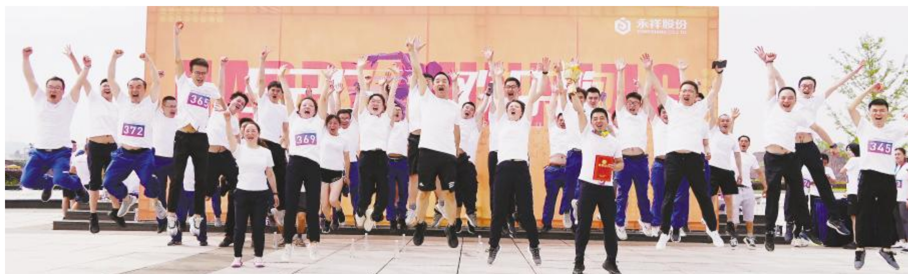
永祥股份举行“520”欢乐跑