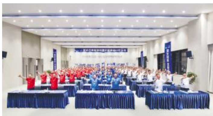
云南通威观看通威40年庆典暨“大干100天·再上新台阶”大会直播