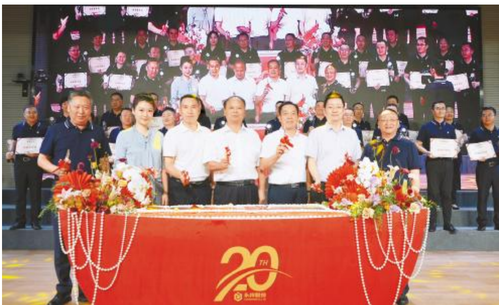
2022 年 7 月 27 日,出席永祥股份 20 年表彰晚会的领导共同切生日蛋糕,共庆永祥 20 年华诞