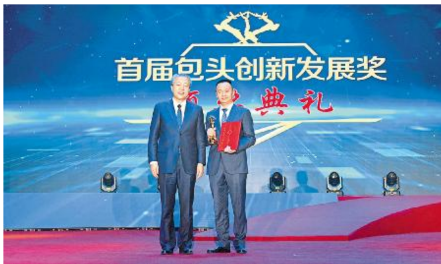
内蒙古通威荣获首届包头创新发展奖