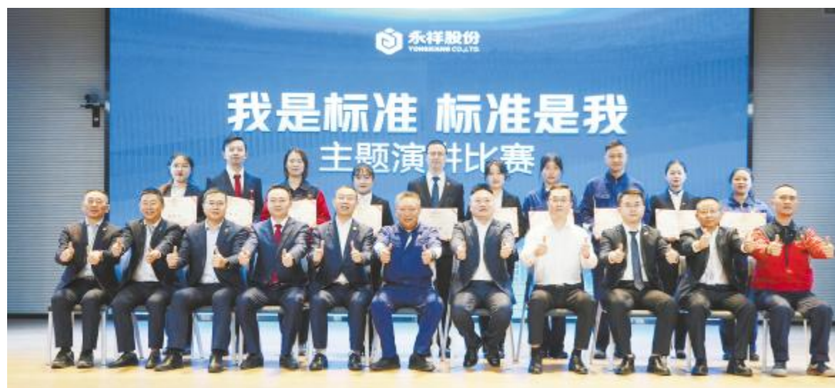
永祥股份“我是标准 标准是我”主题演讲比赛合影留念