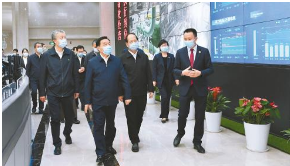
2022 年 4 月 24 日,全国人大常委会副委员长王晨莅临内蒙古通威调研