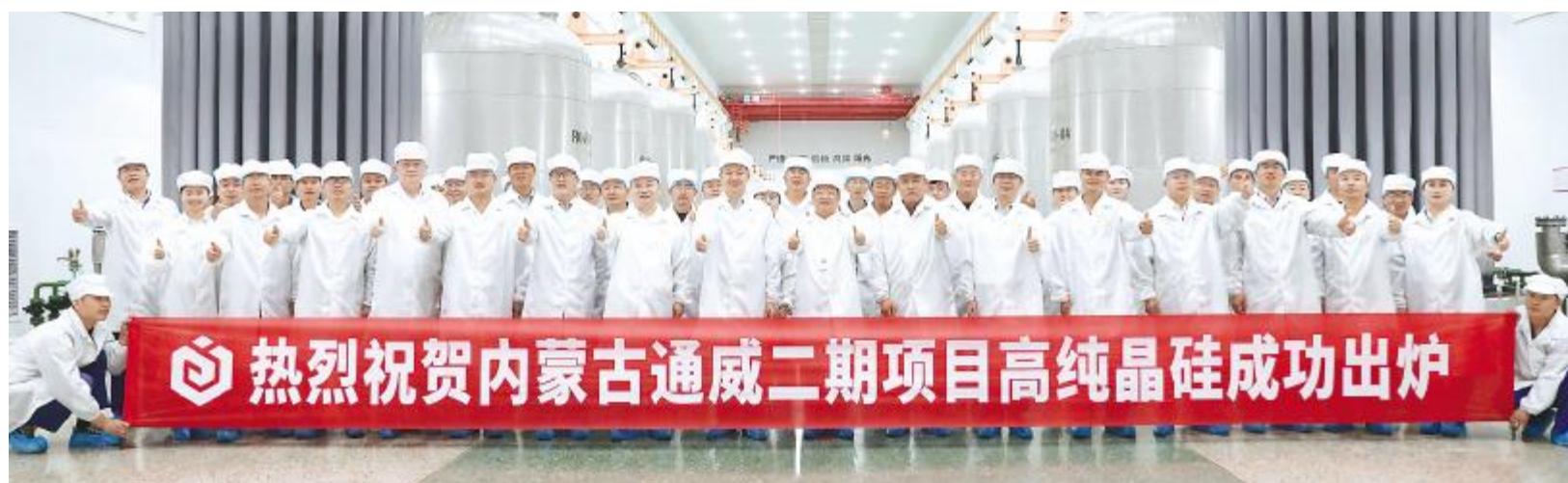
2022 年 7 月 11 日,内蒙古通威二期项目高纯晶硅成功出炉