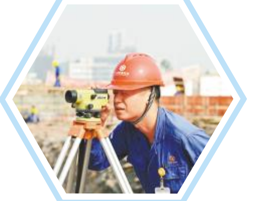
永祥能源科技 甘雨