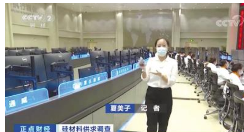
央视财经《正点财经》栏目聚焦报道内蒙古通威