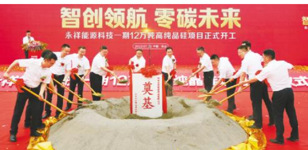
2022 年 7 月 30 日,永祥能源科技一期 12 万吨高纯晶硅项目正式开工