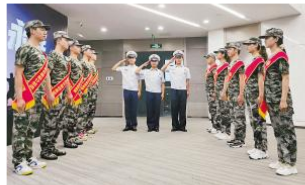
学员进行形象展示