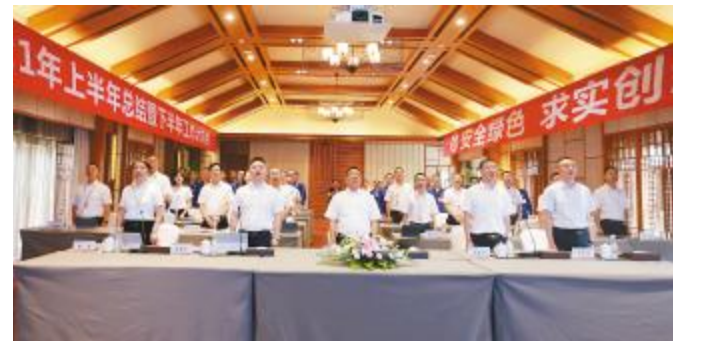
永祥光伏科技 2021 年上半年工作总结暨下半年计划会前,全员齐唱《通威之歌》

李董指出,云南通威在安全、土建、安装、造价控制等方面都取得很好的成绩,充满激情和战斗力的云南通威团队思路清晰、目标明确,措施有力,值得肯定。希望公司继续锁定目标,保持工作状态和工作节奏,提前谋划,充分准备,为投产目标全力以赴。李董强调,安全是所有工作的前提,项目建设进入交叉作业高峰期,要把安全工作落实到位;加强安装、设备调试质量管控与人员培训,做到“物料走到哪里,技术和管理人员就要走到哪里”,完善标准并执行到位,为开车夯实基础;设备调试过程中,计算好储能消耗,保障设备备件充足。全体云南通威人要围绕既定目标全力以赴,用实力和精品捍卫团队的尊严!