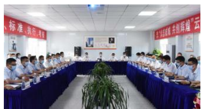
云南通威高纯晶硅公司 2021 半年度总结计划会现场