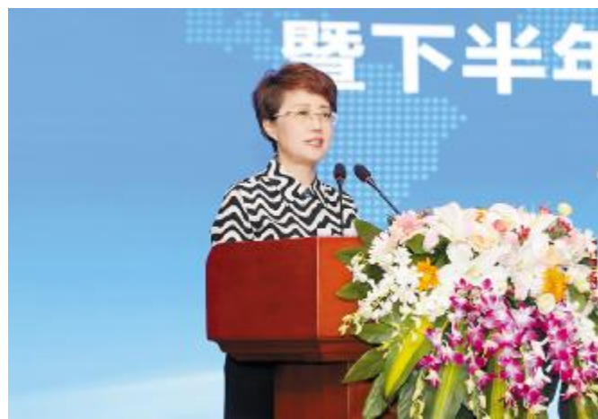
糕玉娇总裁在会上讲话