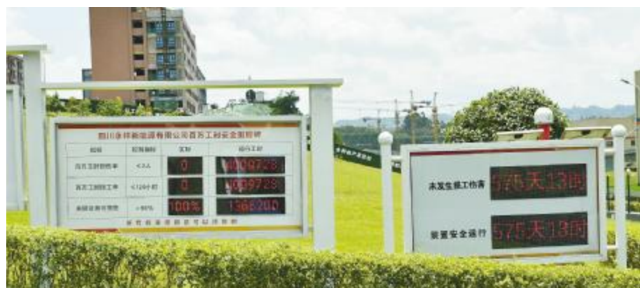
永祥新能源“百万工时”安全里程碑

本报讯(记者 唐黄之 通讯员 郎学延 陈玲)7月12日,永祥新能源累计安全无事故达到575天,再次实现了一个“百万工时”无事故。这也是自2019年12月15日公司推行百万工时安全里程碑管理以来,实现的第四个“100万工时”无事故。