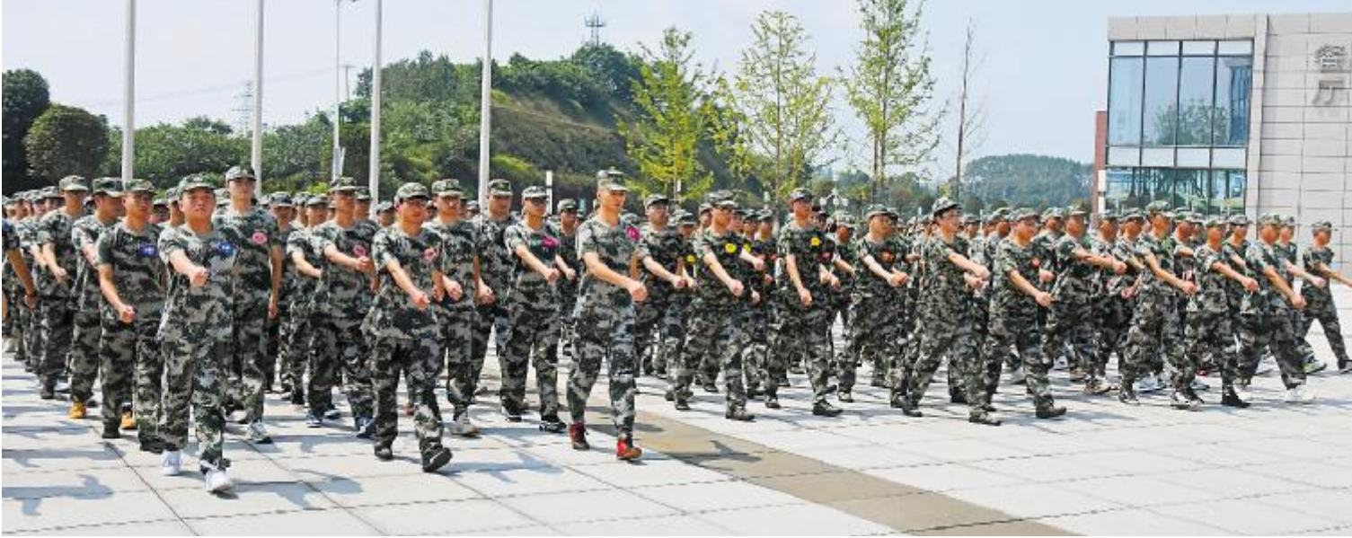
在军训中磨炼意志