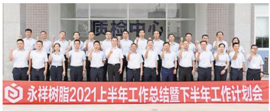
永祥树脂 2021 上半年工作总结暨下半年工作计划会合影留念

李董指出,管好、做好自己的事情永远是面对竞争的最好方法,公司上半年取得的成绩有目共睹,相信在下半年定能克服艰难险阻,实现公司经营目标。李董强调,安全是所有工作的前提,安全无小事,在工作中一定要层层落实安全责任,根据实际情况及特性完善落配套安全措施;人人讲安全,人人懂安全,形成安全文化氛围,提高员工安全意识。全体干部员工要团结一致,聚势聚焦,共同做好永祥、做好自己。