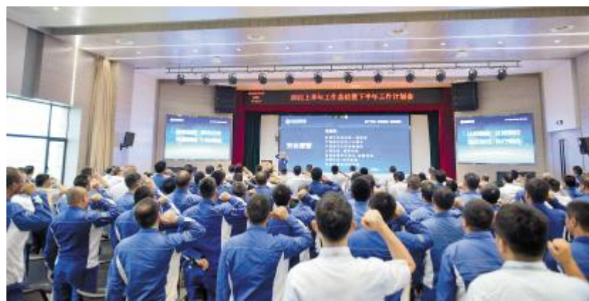
永祥新能源上半年工作总结暨下半年工作计划会上,全员进行安全宣誓