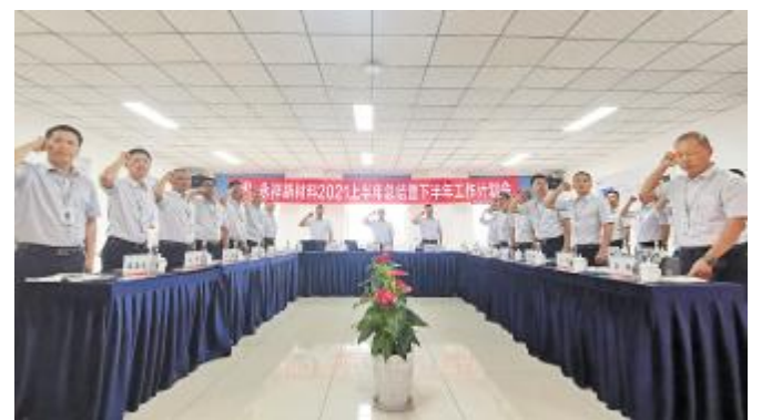
永祥新材料 2021 上半年工作总结暨下半年工作计划会前,全员进行安全宣誓