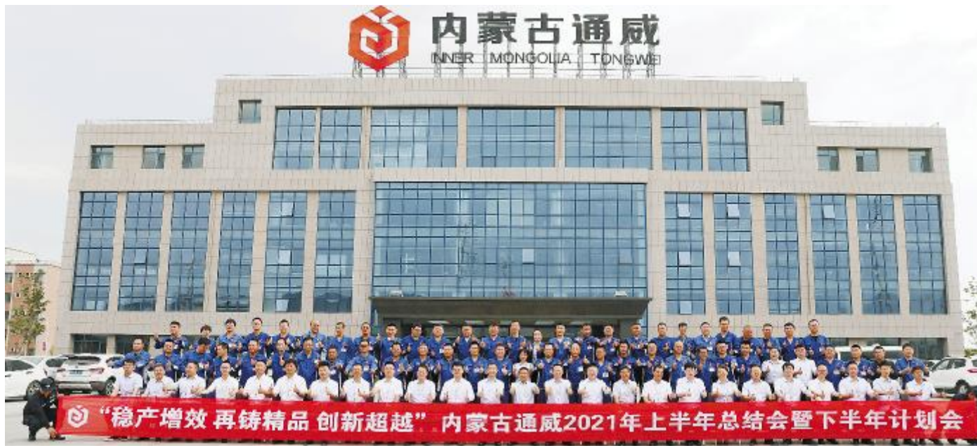
内蒙古通威高纯晶硅公司 2021 年上半年总结会暨下半年计划会合影留念