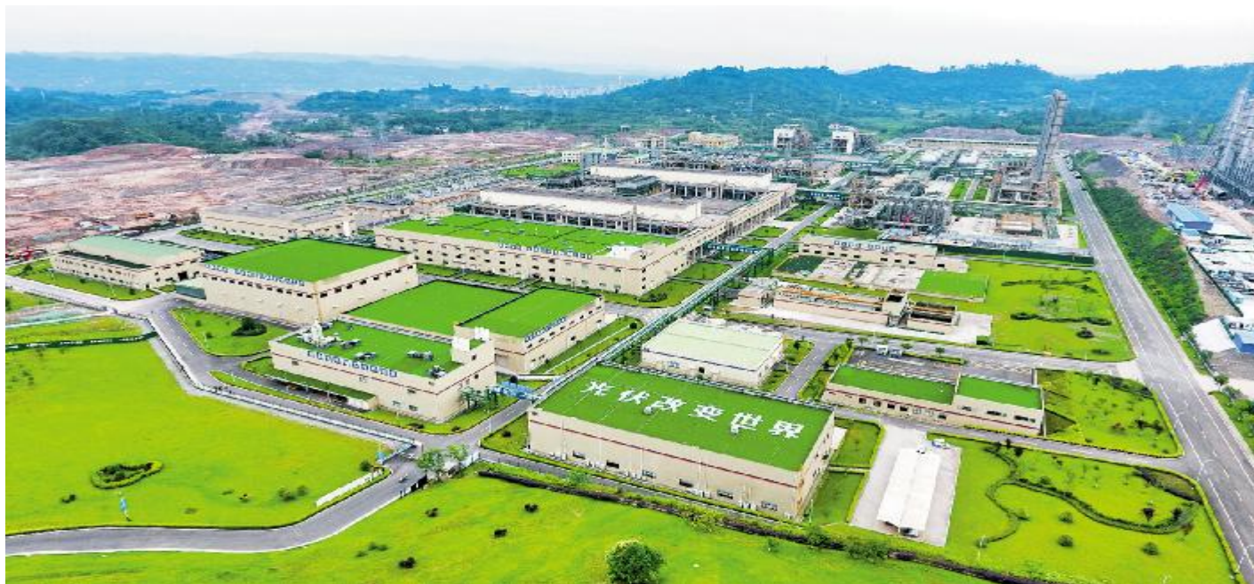
永祥股份花园式工厂

刘主席强调,未来我们的工作将会做得更好,平台也将会更加有力,大家一起共同努力,全球能源转型过程中最浓墨重彩的一笔一定会有通威人、永祥人的历史!