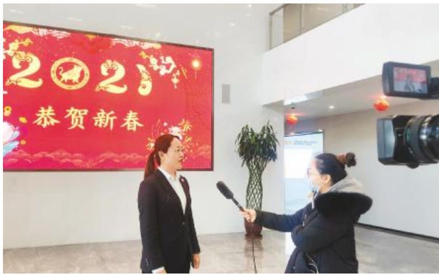
主流媒体聚焦内蒙古通威高纯晶硅“就地过年”暖心举措

2月,永祥股份四川乐山、内蒙古包头两大高纯晶硅基地保持安全、高效运行,云南保山高纯晶硅基地项目建设如火如荼,得到了社会、媒体的高度关注。《人民日报》、新华社、《内蒙古日报》《包头日报》《包头晚报》等媒体《就地过年待春归》栏目专题聚焦内蒙古通威高纯晶硅员工坚守岗位就地过年;《乐山日报》两次聚焦永祥乐山高纯晶硅新项目建设及春节坚守岗位,给予了永祥发展成绩高度肯定。