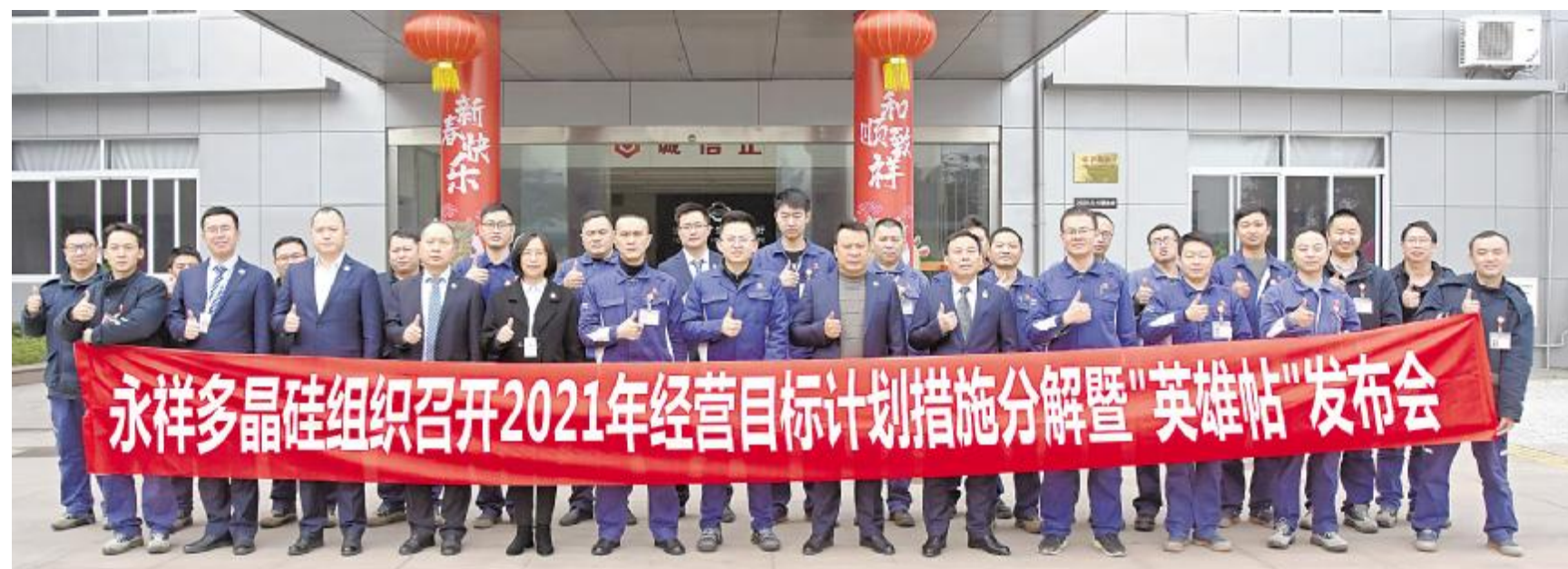
永祥多晶硅 2021 年经营目标计划措施分解暨“英雄帖”发布会合影

2月,永祥股份各基地、各公司在顺利保障春节期间安全稳定生产、新项目安全有序建设后,迅速调整状态,全面推进新一年的各项工作。永祥新能源、内蒙古通威高纯晶硅领导发挥表率作用,带队深入一线开展检查,强化安全管理;永祥硅材料、云南通威高纯晶硅节后立即召开收心会,动员全体员工立即进入状态,以良好的精神面貌投入到工作;永祥多晶硅发布“英雄帖”,凝聚力量,迎接挑战;永祥树脂明确管理提升方向,稳产增效,创新超越;永祥新材料按计划推进大修,做好各项保障工作。