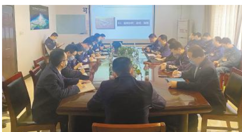
永祥硅材料、永祥光伏科技召开生产管理提升专题会