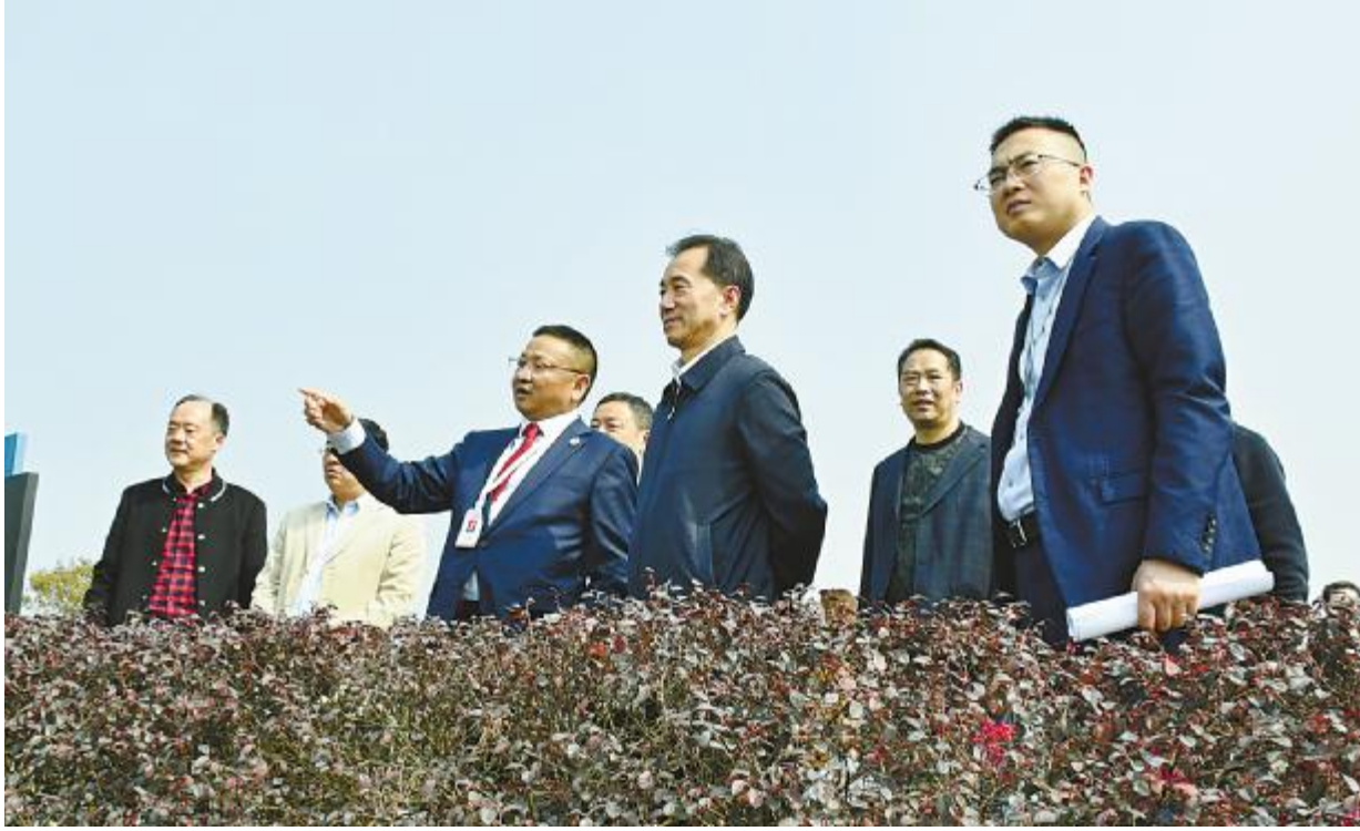
陈放主席听取永祥股份发展成果汇报

2月23日,全国工商联副主席、四川省政协副主席、省工商联主席陈放莅临永祥新能源调研。四川省工商联副主席胡寿涛、乐山市政协常委席易凡、五通桥区委书记张国清等领导陪同调研。永祥股份总经理兼永祥新能源总经理李斌、永祥股份副总经理易继成、永祥新能源副总经理罗周、安环总监杨武明等领导热情接待。