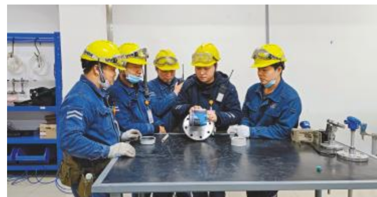
不放过任何一个机会,用心学习和交流,春节分享最快乐