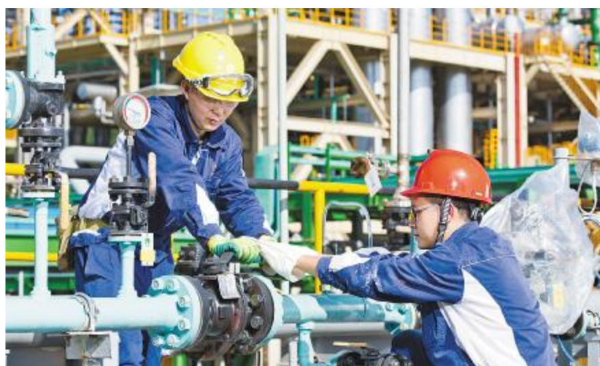
永祥员工在工作中精益求精,确保装置稳定运行

2021年,永祥将以“标准、平面、视频、渠道、根基”为文化建设关键词。标准:三大基地,文化归一。要求月月有主题,按照月度模板归类,在体现永祥板块整齐划一的文化氛围情况下,各公司适度创新;平面:塑造“一个IP”。在永祥阿米巴经营哲学基础上,梳理、应用好永祥VI体系,衍生永祥文创;视频:实施双管齐下。一方面以功能性广告片呈现;一方面以更接地气的方式,夯实基础。提升永祥整体形象,提高影响力,为人才引进助力;渠道:拓展传播途径。多方位,多创意,年轻化地