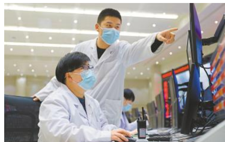
假期也要教好“徒弟”,让他技能快速提升