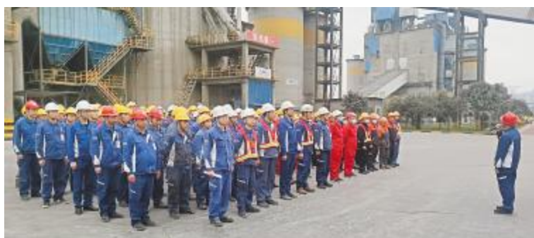
永祥新材料年度检修安全大会现场

通讯员 杨彦超 潘爱原 刘召伦 周海容 宁波 田晨怡 车双雨 孔祥晟 侯永峰 林心喻