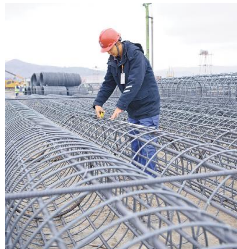
永祥员工严把工程施工质量关