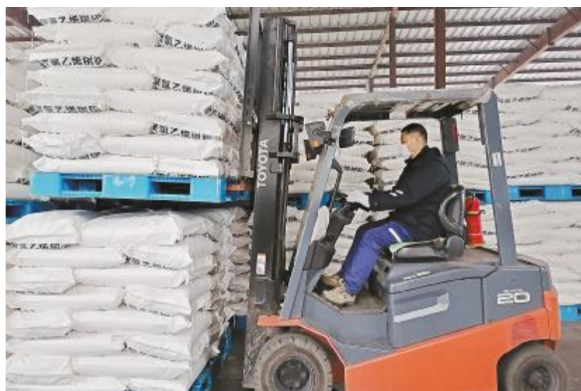
新年我在岗坚守,我的工作是一周而复始地搬运PVC,我会用专业、敬业、精业的工匠精神,做好每一轮堆码