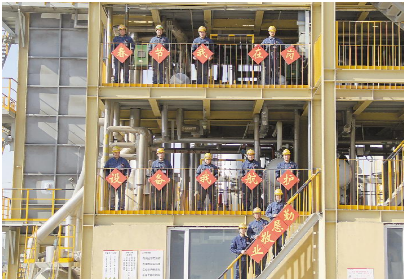
当好排头兵,甘作螺丝钉,春节我在岗,设备运行我保障