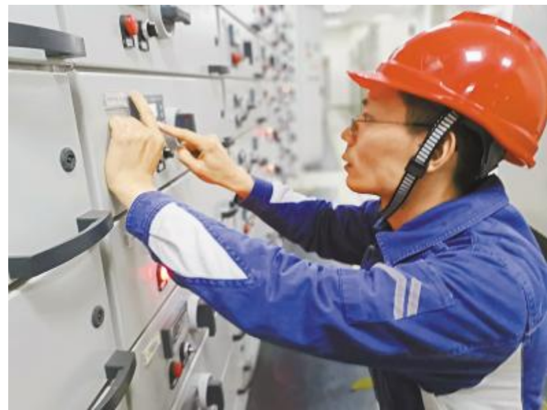
专注检查电气设备,确保装置稳定运行