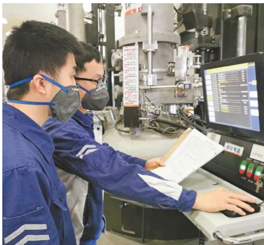
做好“师带徒”,为新项目储备人才添砖加瓦