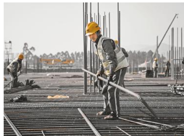
春节我在岗,正是因为他们的坚守才换来了万家团圆、幸福