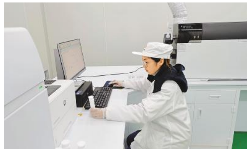
春节我在岗,用心工作,用智慧工作,专注做好生产的“眼睛”