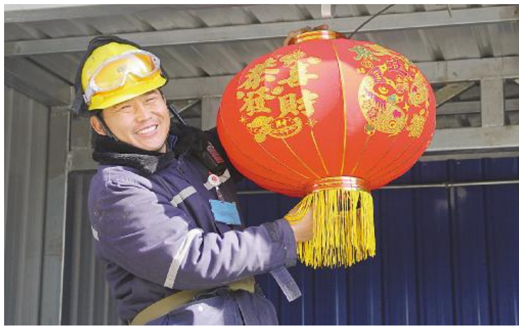
大红灯笼高高挂,春到、福到、好运到,我在内蒙古通威高纯晶硅给您拜年