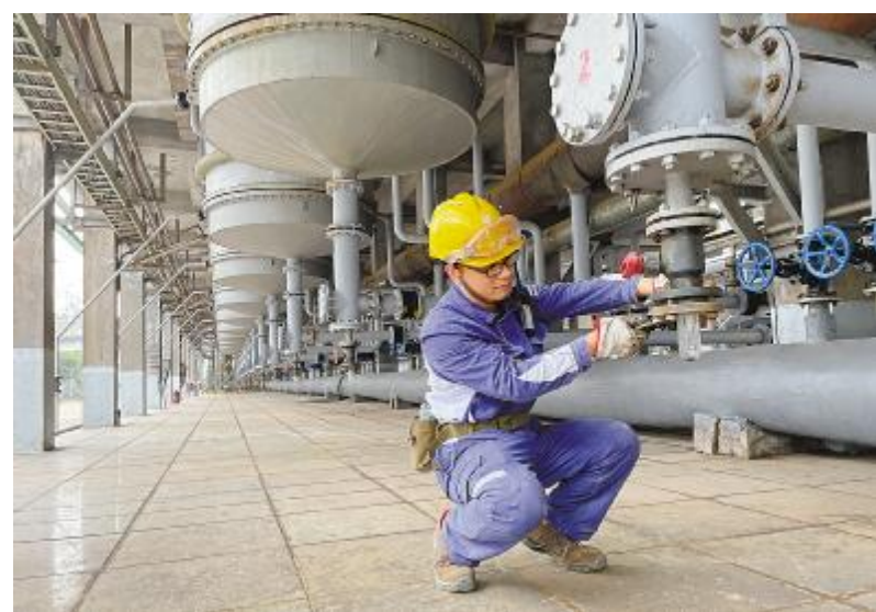
牢记肩负的职责使命,扎实推进巡检工作,抓好各项生产措施,用我们的奉献换来大家的安全、欢乐、团圆