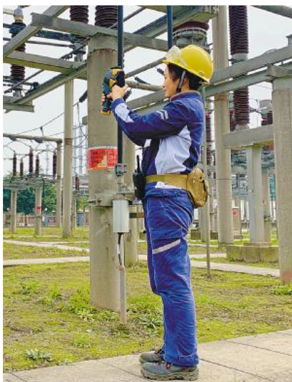
110KV 祥威变电站场地设备巡检测温