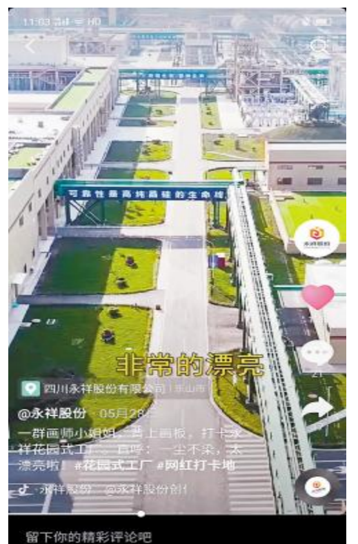
永祥股份原创抖音获员工关注