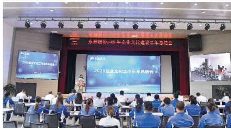
永祥股份 2020 年企业文化建设半年总结会现场

在疫情期间传播文化、做好宣传,为公司打赢疫情防控战做好了各项服务工作,做出了永祥特色。各公司企业文化活动百花齐放,“女神节慰问”“植树节”“欢乐跑”“庆六一”“员工家属接待日”“网红打卡”“大讲堂,大家讲”等活动,进一步促文化落地,深入每一位员工内心。会上,对在2020年企业文化建设工作中表现优秀的宣传员进行了表彰。