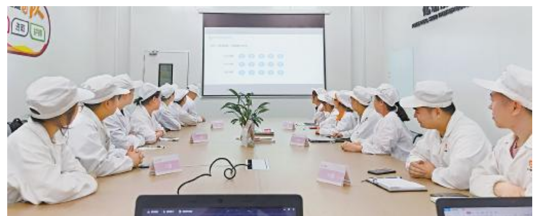
永祥新能源成功举办“安全知识竞赛”