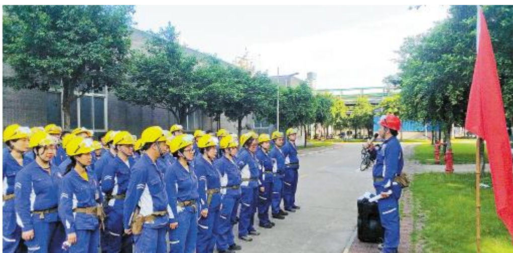
永祥多晶硅调度室组织开展大网失电应急预案演练

启动仪式只是“安全生产月”活动的序曲,接下来,内蒙古通威将全力营造出更为浓厚的安全氛围,大力弘扬安全文化,夯实安全基础,确保安全生产持续稳定。