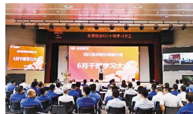
干部学习大会现场

好标准管理,加强风险把控,八大高危管控、JCC检查,用好清单管理,要以空杯的心态去拥抱信息技术,扎扎实实做好安全工作,只有做好了安全工作,产能、成本、利润才有保障。要不断自我总结与批评,举一反三,学会自我照镜子,不断前进,才能活下来,才能活得好。在上下同心努力奋斗下,我们度过了今年最困难的时期,将迎来光伏行业新的机遇。面对市场发展形势,必须做好安全工作,