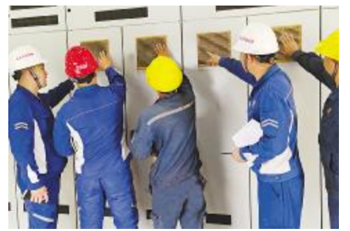
永祥硅材料开展电气设备安全隐患排查活动