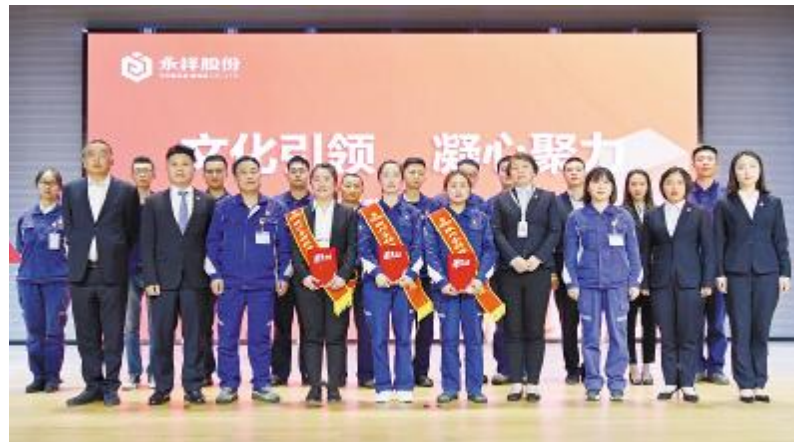
永祥经营哲学案例宣讲系列大赛持续举行,传递正能量

例宣讲系列大赛和巡回宣讲活动,进一步促进文化植入人心。通过各项主题活动,因地制宜地宣传永祥文化,树立良好的企业形象,取得了良好的宣传效果。基本实现平面与新媒体双翼齐飞,尤其是永祥故事系列,挖掘经典,凝注永祥文化,成为鲜活教材。在具体工作中,强化服务输出,工作能,提高工作能效,打好了文化建设党政工的组合拳。