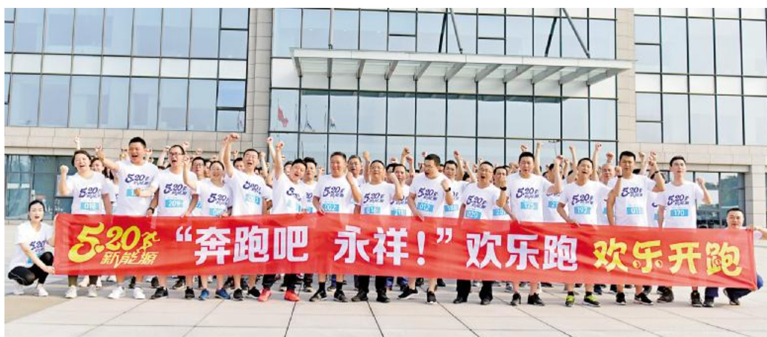
永祥新能源“欢乐跑”活动热闹上演