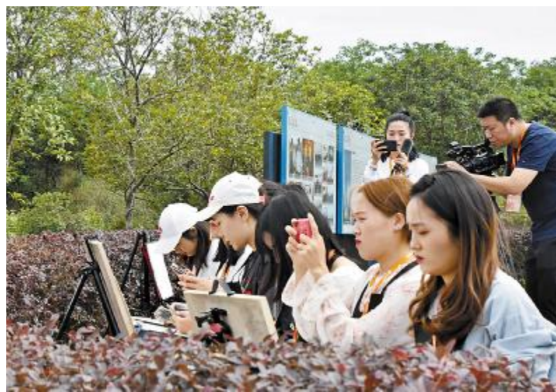
永祥股份“花园式”工厂吸引美术学校师生走进公司厂区写生

形式聚焦战高温斗酷暑、工程建设以及端午、中秋、国庆、春节等传统节日,继续发文化引领作用。会议对下半年工作作出相应要求,要求夯实工作基础,提升宣传能力,在传播方式、新闻头、新闻点挖掘方面进行创新,要 在前面,干在实处,走在前列。遵照通威集团董事局刘汉元主席的指示,“眼中有故事,心中有格局,下有泥,心中有光!”