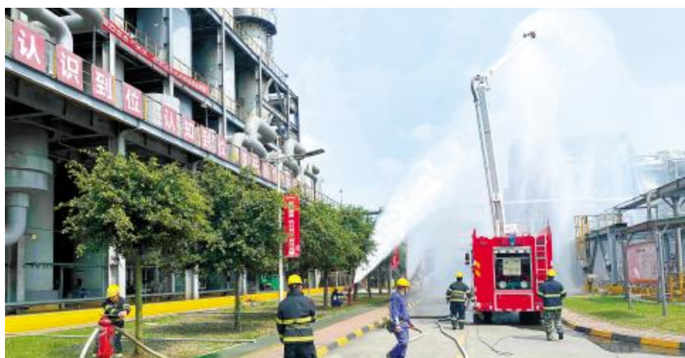
开展公司级应急救援演习,保持“高压”状态