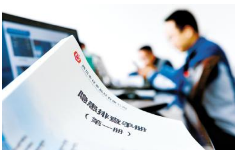
编制隐患排查手册