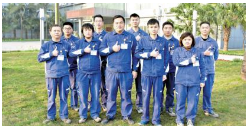
永祥多晶硅生产部还原一工段