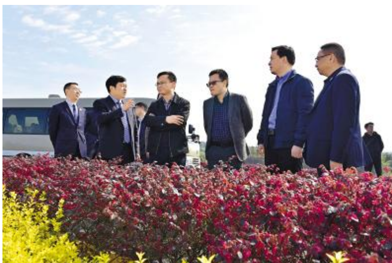
调研组详细了解永祥防疫工作和复工复产情况

在内蒙古通威高纯晶硅,调研组详细了解了公司在疫情期间的安全生产和防疫措施,袁总汇报了相关工作,并表示,疫情期间,自治区、包头市及昆都仑区各级政府领导多次亲临公司指导疫情防控,帮助落实国家税费减免相关政策,公司积极履行责任,做到疫情防控、安全生产“两手抓,两不误”。通过实地调研和听取汇报,调研组对公司的行业竞争力、发展规划、经营模式给予肯定,并表示,政府相关部门将助力企业发展。希望内蒙古通威高纯晶硅未来的发展越来越好,为当地经济社会发展作出更多、更大的贡献。