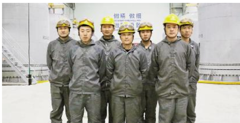
内蒙古通威还原工段