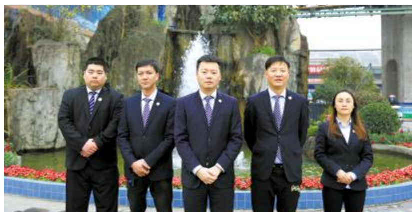
永祥新材料商砼销售部