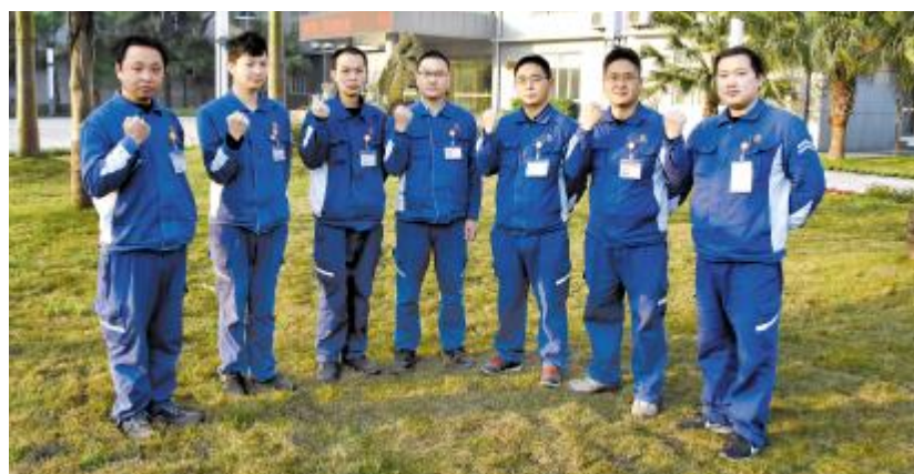
永祥硅材料技术部