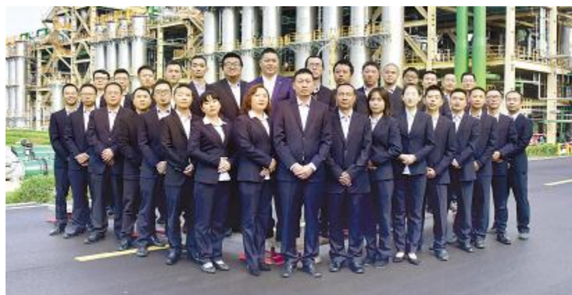
永祥新能源生产部