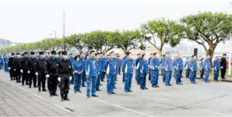
永祥树脂 2020 年生产经营任务挑战动员会现场