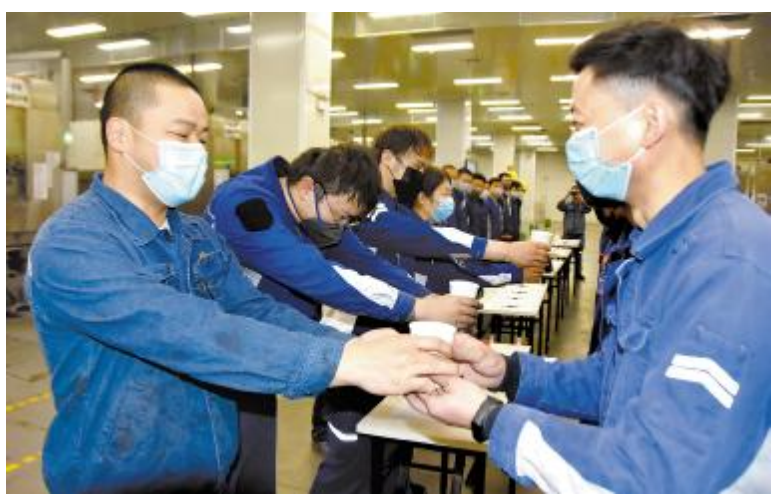
永祥硅材料“师带徒”拜师仪式现场

会上,各项目负责人对所负责项目的进度进行汇报,并对大修期间必须完成的内容、施工力量、施工时间等进行具体讨论。周总强调,要将会议讨论的总体安排,细化为详细事项,明确工作节点、工作内容、注意事项等,确保大修工作的顺利完成。