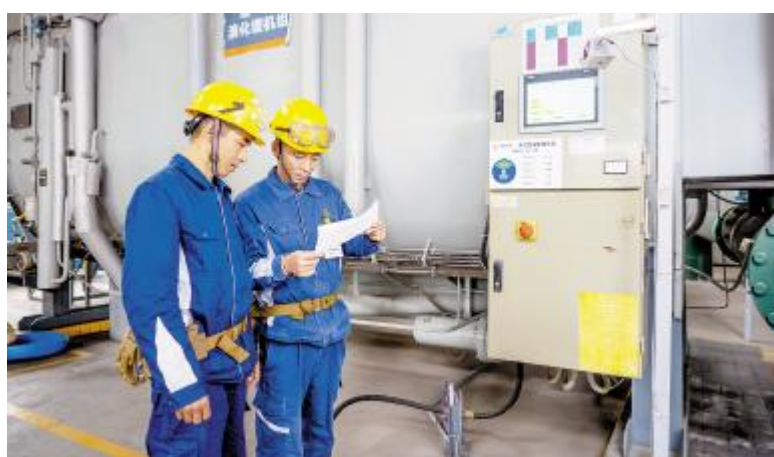
员工严格执行标准操作细节