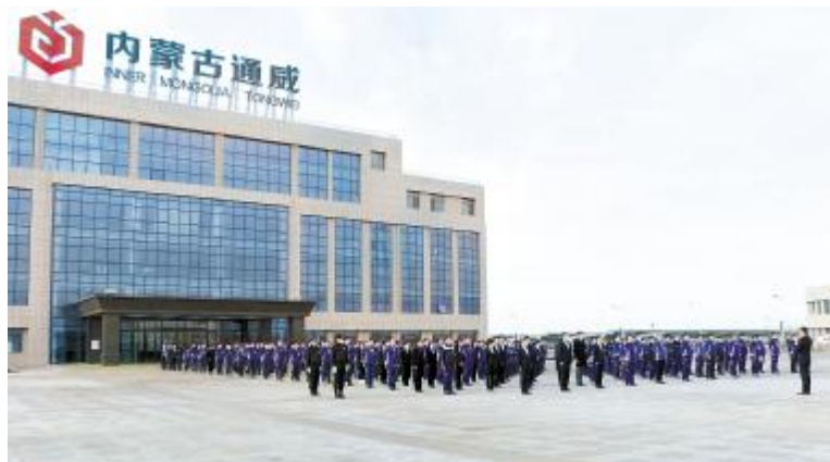
内蒙古通威高纯晶硅工作动员会现场

李总表示,二期项目将面临更大挑战,与之匹配的是管理团队能在一期的基础上突破创新,通过不断提升各项指标,对标学习,提升管理水平,打造装置的高可靠性,长周期安全稳定运行,安全一票否决。清单应用将在工程建设全面深入铺开,从每一个垫片,每一个阀门安装开始,从源头把控,做到精准安装。要提高管理和装置运行水平,持续优化工艺,保障设备选型更加可靠,要强化人员培训和管理人才梯队建设,实现永祥股份董事长兼总经理段雍的“5个全新”指示:全新的技术创新、全新的智慧工厂、全新的产品定位、全新的战略定位、全新的核心竞争力,打造精品工程。