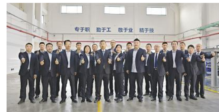
永祥新能源设备动力部