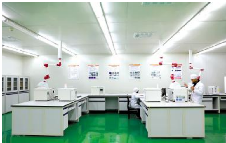
品管部实施标准化、可视化