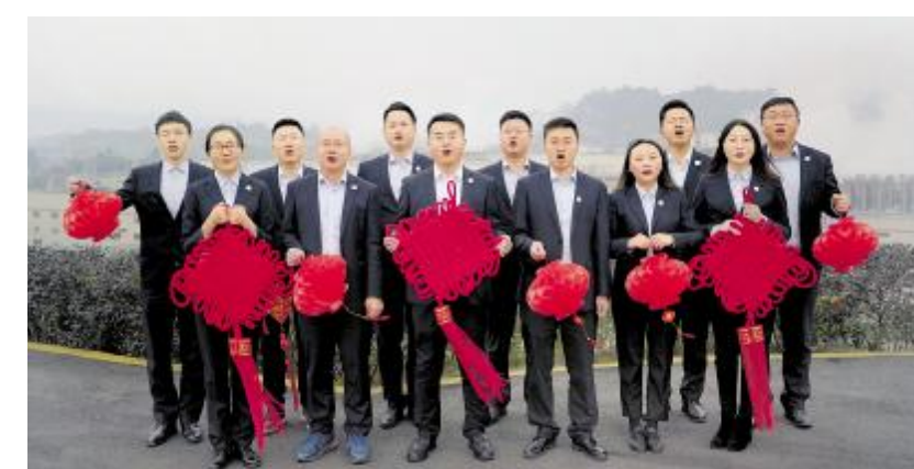
永祥股份本部营销中心