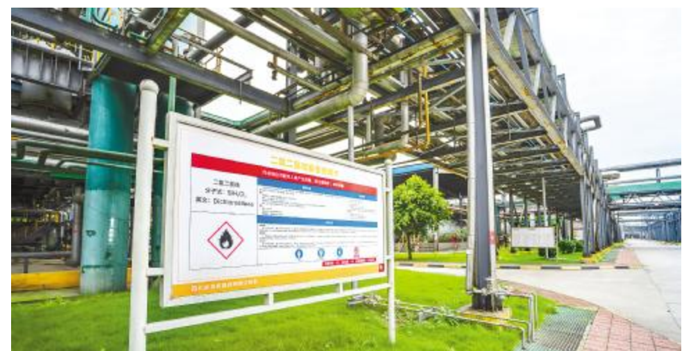
厂区内安全告知卡清晰可见