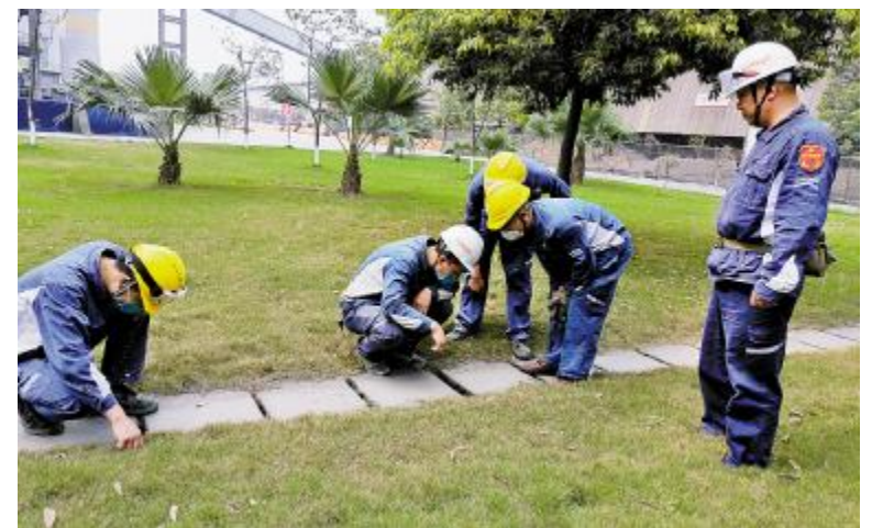
永祥新材料开展防汛防讯专项检查

根据公司实际生产经营特点,检查前编制《防汛防讯专项检查清单》并于3月24日,组织各工段负责人按照清单内容对河堤坝坎、公司厂房及构筑物、排水沟、水浸风险较大场所、重点区域与设施、道路堆场、防汛物资等进行认真排查,对检查发现的隐患汇总编制下发了《防汛防讯专项检查通报》,明确了整改要求和内容,落实责任人限期整改。同时要求各工段须加强对重点区域、特殊设备的防护,对防汛设施设备、排洪沟渠及时进行维护、疏通,做好雨季生产的方案组织和防汛应急演练,确保雨季汛期人员和设备安全。