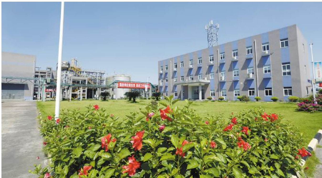
永祥树脂厂区鲜花盛开

9月,永祥股份继续保持安全、稳定、快速的发展态势,永祥多晶硅、永祥树脂、永祥新材料、永祥硅材料、永祥新能源、内蒙古通威高纯晶硅各项生产、经营活动有序开展,各类管理提升、技能培训持续推进,稳中有进,为完成全年目标积蓄能量。