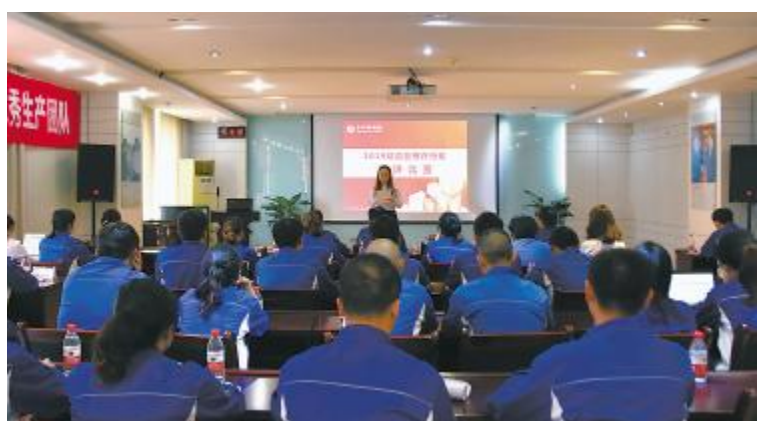
永祥多晶硅、永祥硅材料“精益管理”主题演讲比赛现场

为有效开展作业场所职业健康监管,加强员工健康保护,减少职业危害事故,切实维护员工生命和健康权益。本月初,永祥多晶硅、硅材料积极组织涉及粉尘、噪声、高温、氯气、氯化氢、氯硅烷、电工、机动车、压力容器、视屏作业等岗位生产作业的432名员工进行了职业健康体检。通过开展职业健康体检,有助于公司全面了解员工健康状况,为职业健康管理提供了可靠、真实的依据,使职业病防治工作中提出的“预防为主、防治结合”原则落到实处,同时切实保障了广大员工的身心健康。