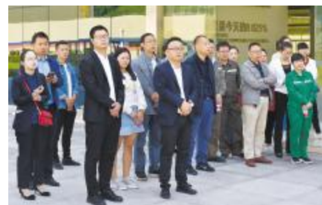
全国质量日活动走进永祥股份

随后,代表团先后前往了公司展厅、中心控制室和观景平台进行了参观,详细了解了永祥的发展历程,高纯晶硅产业的发展状况和市场前景以及公司品管部的规模、质量管理设备的配备、实验室的规划、先进的检验仪器设备、重点工艺指标的质量监控等。通过实地参观和听取介绍,代表团高度肯定了永祥的发展成绩,并表示,永祥领先的技术、花园式的厂区环境都颠覆了大家对传统化工企业的印象。永祥无论是厂区环境、规模、产品质量都走在了行业的前列,无愧四川优秀企业的代表。希望永祥能继续再接再厉,为质量强国作出更大的贡献。