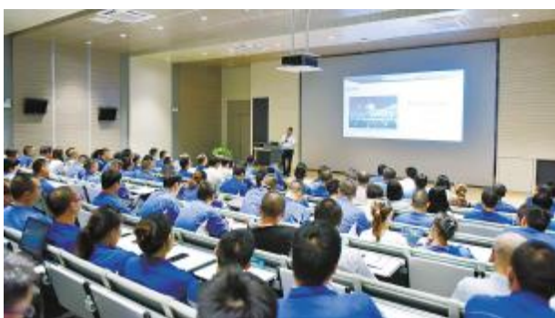
永祥股份各公司开展《永祥经营哲学》宣贯