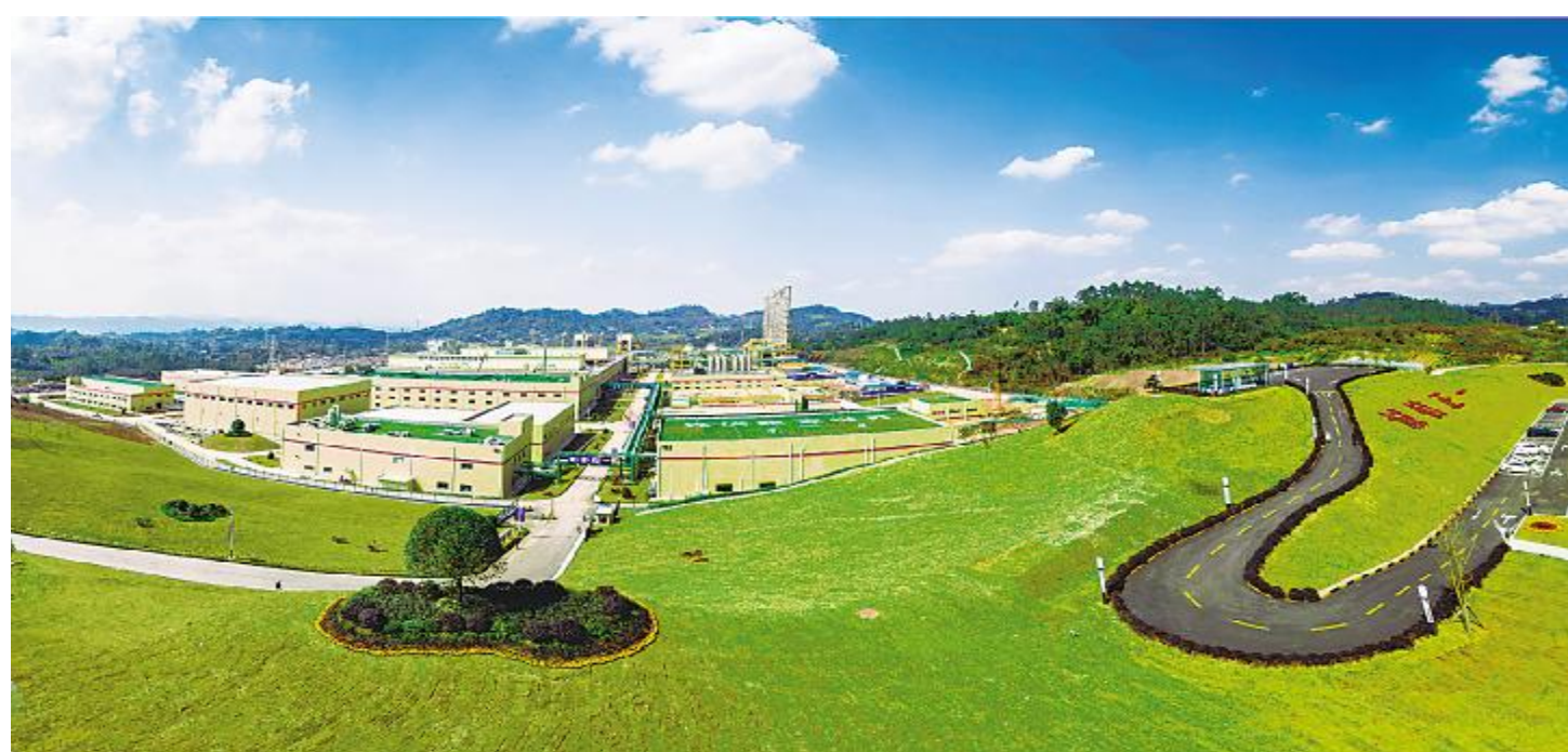
永祥新能源绿色厂区