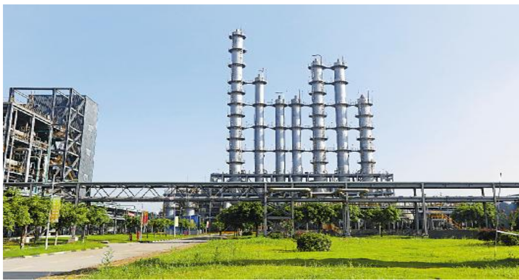
永祥多晶硅绿色厂区