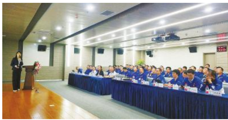
内蒙古通威高纯晶硅管理干部学习会现场