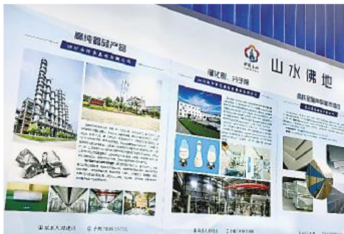
永祥股份亮相国际科技博览会

成果展示。作为半导体工业、电子信息领域和清洁能源环保领域主要原材料的生产企业,永祥多晶硅在展会精彩亮相,获高度关注。参会客商代表纷纷驻足观看、拍照、咨询交流。在清洁能源领域,永祥时刻以技术创新作为企业发展的驱动力,在不断提升晶硅纯度和质量的同时,有效降低了生产成本,为清洁能源的平价推广作出了贡献;在半导体工业、电子信息领域,永祥将持续不断地深耕工艺技术,累积半导体电子级晶硅的研发经验,助推行业不断向前进步。