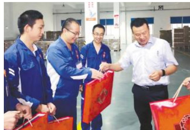
永祥股份各子公司领导走进生产一线为员工送上月饼