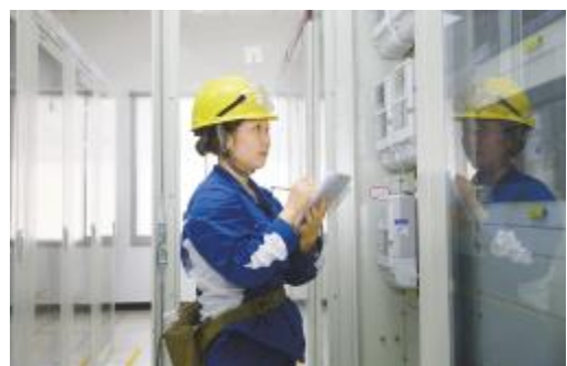
认真记录装置运行数据