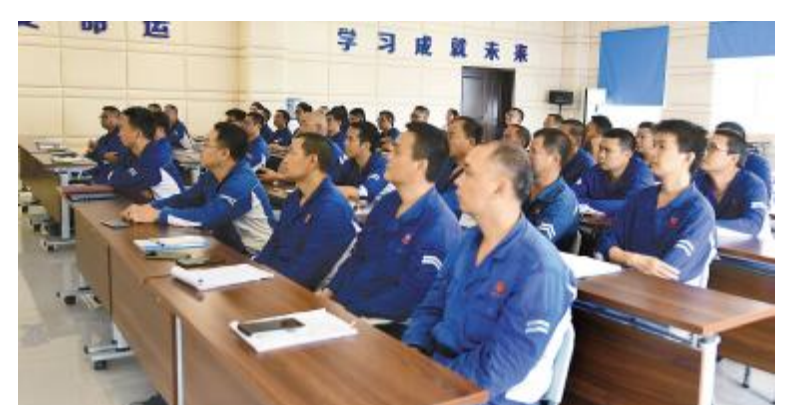
永祥树脂“设备润滑保养”培训现场