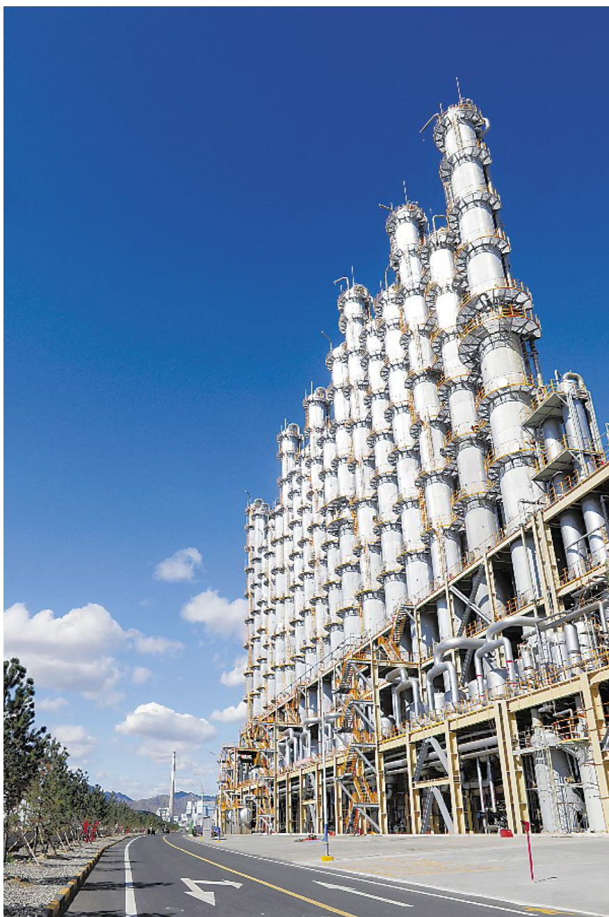
内蒙古通威高纯晶硅精馏塔装置