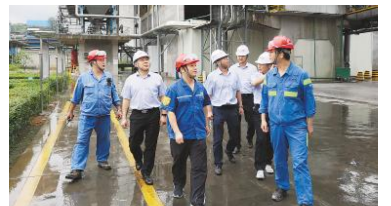
永祥新材料组织管理干部赴东方希望对标学习