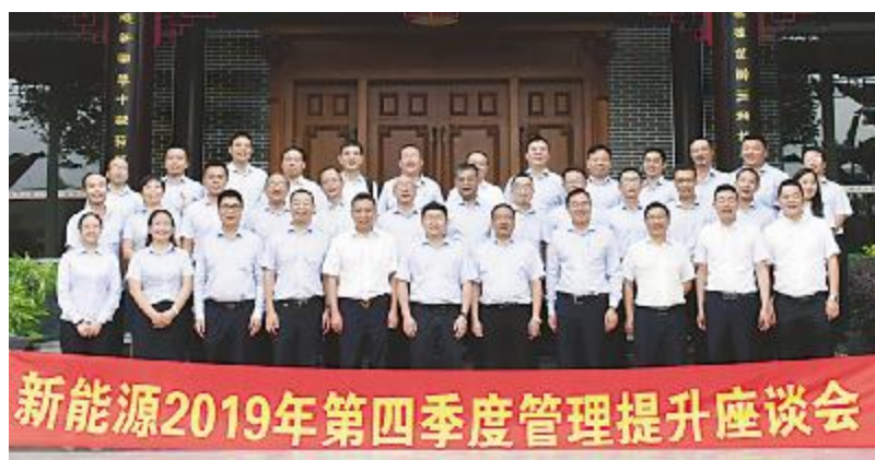
永祥新能源第四季度管理提升座谈会合影