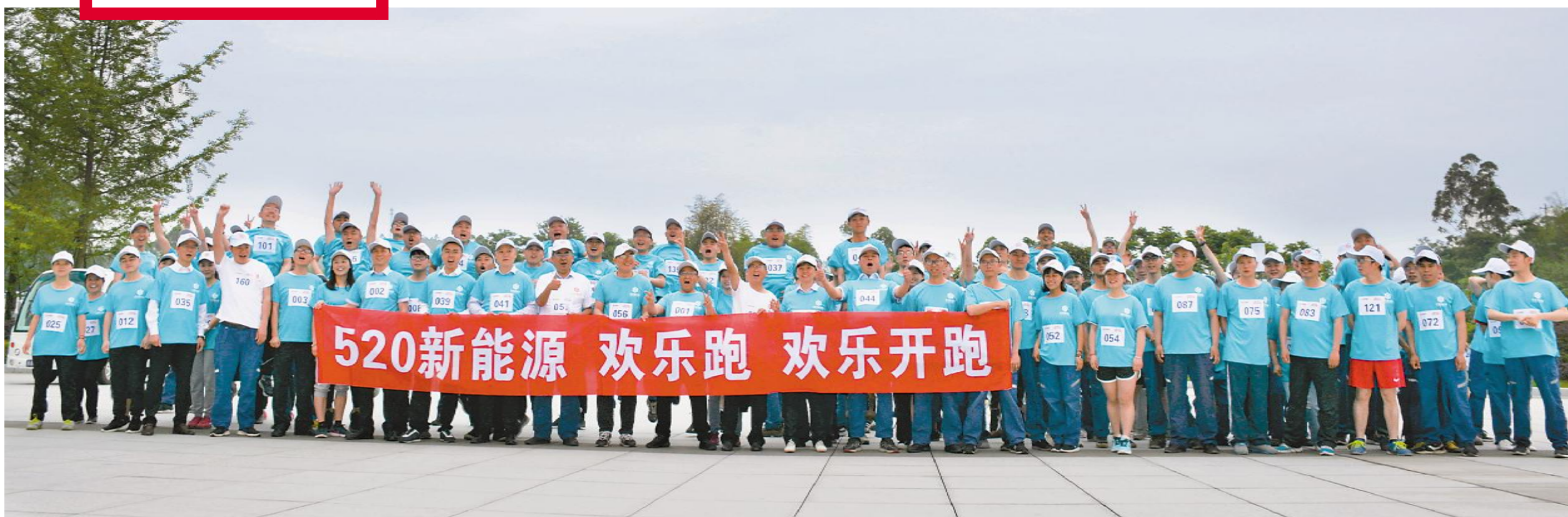
永祥新能源举行员工欢乐跑活动