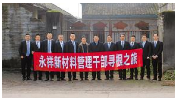
永祥新材料开展管理干部寻根之旅

利用好沟通和解决问题的途径;利用好观念教育引导培训的途径;利用好文化传播宣传导向的途径。