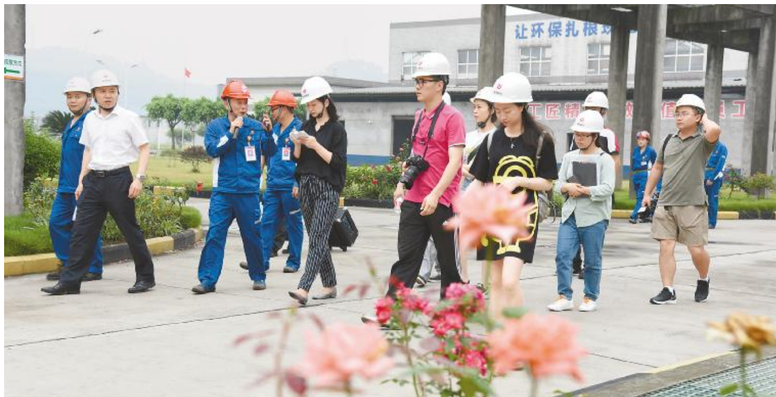
6月21日，《四川日报》等主流媒体聚焦永祥股份“清单管理”