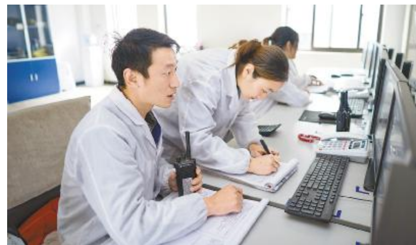
严格监控生产中的各项数据

川报观察则以《探访危化企业：画个圆弧也能避免事故？这些细节带来满满安全感》为题报道了永祥安全管理，文章介绍，人是公司本质安全的“灵魂”。通过细节提升工人的安全意识，记者发现，永祥股份员工上下楼梯都是手扶栏杆靠右行走，在厂区内行走则是“两人成排、三人成列”。这些要求很细，看起来与一线的安全生产关联性不大，但公司希望通过这样的细节，培育员工的安全意识，提高他们的规则意识。