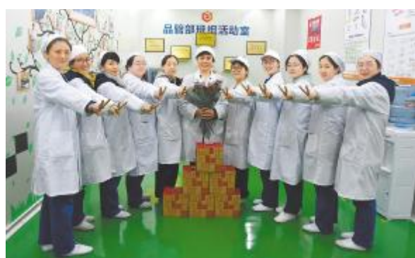
永祥多晶硅开展三八妇女节主题活动