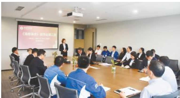
永祥股份开展《清单革命》读书会

6月，永祥多晶硅、永祥硅材料、永祥树脂、永祥新材料、永祥新能源、内蒙古通威高纯晶硅也积极开展《清单革命》学习，分公司、分部门、分工段，以干部学习会、读书会、培训会、讨论交流会形式展开，为接下来“清单管理”的推进，打下了坚实基础。