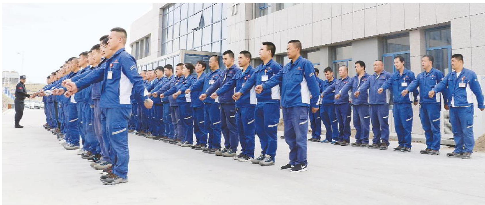
内蒙古通威高纯晶硅开展主题军训