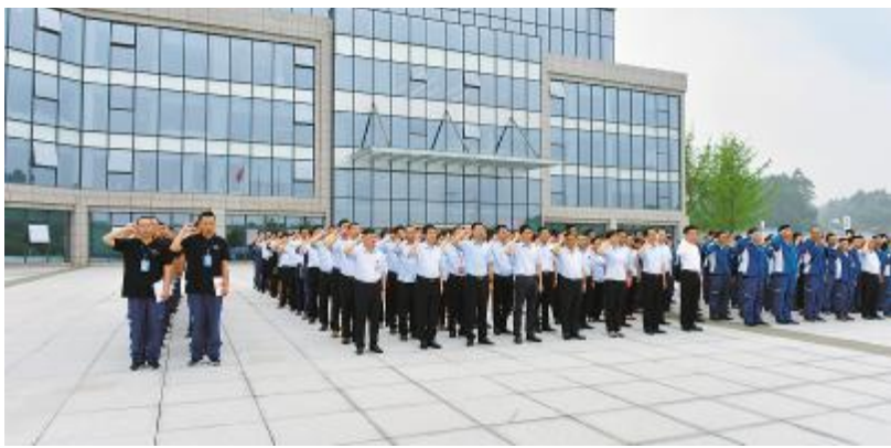
永祥新能源安全宣誓活动现场