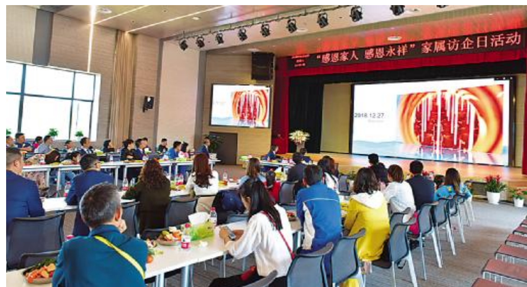
永祥新能源开展员工家属访企日活动

永祥股份全力为员工营造良好的工作、生活环境,除了花园式厂区打造,食堂、宿舍提档升级外,通过各种活动增强员工的归属感和认同感。如举行职工运动会、员工生日会,各种节日主题活动策划,提高员工幸福指数。同时,通过员工家属访企日活动开展,为员工患病家属募捐,全方位关爱员工的工作、生活方方面面。