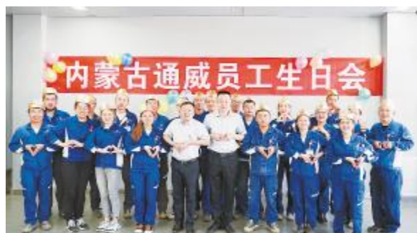
内蒙古通威高纯晶硅举行员工生日会