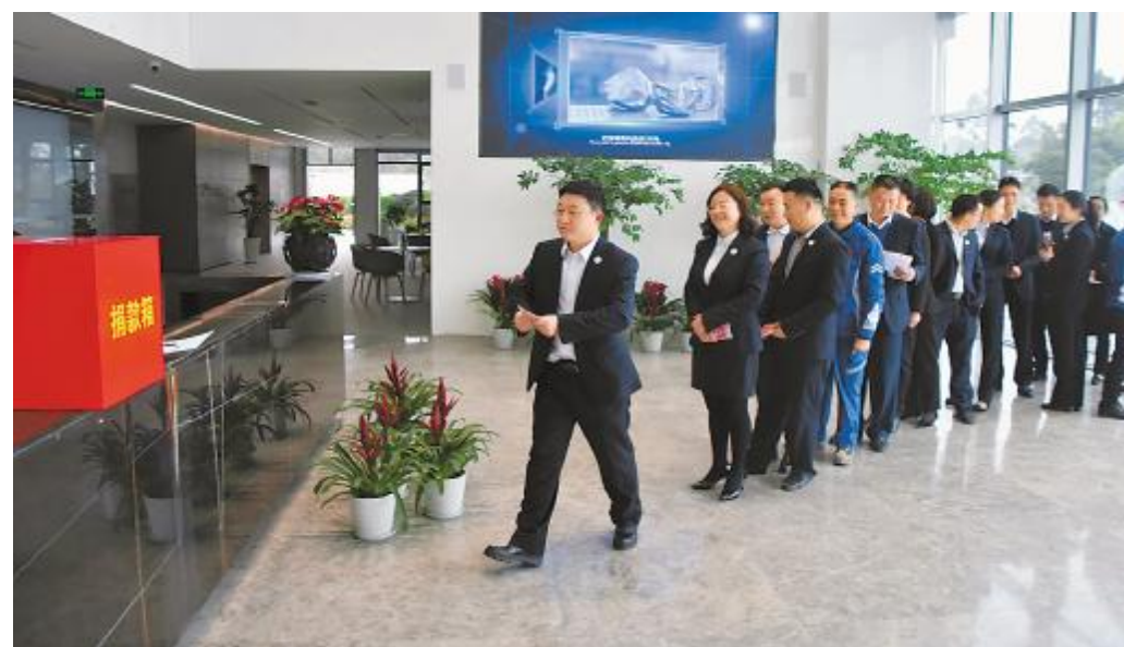
永祥股份组织开展爱心捐款活动

今年以来,永祥股份积极为员工搭建各种学习、提升的平台。除各公司不定期开展各项培训外,3月28日-6月28日,永祥股份开展了九期班长综合素质提升班,各公司267名班长参加培训。班长培训课程以“情绪与压力管理”“一线主管技能”“沟通演讲技巧”等实效培训为主,并且强化班组长团队执行力、沟通协调力、自我素养与评价,进行全面培训学习。通过专业的理论教学和丰富多彩的团建活动,使学员从思想观念到行为举止进行全新的洗礼和重塑,并强化参训人员的团结互助精神,为今后班组工作开展夯实基础。