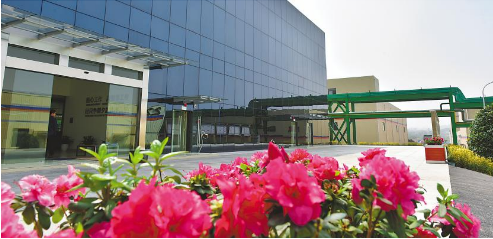
永祥新能源公司厂区鲜花盛开