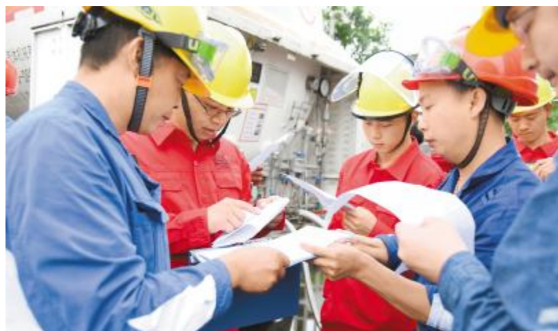
认真对照清单实施