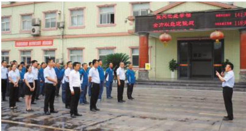
永祥新材料2019年半年挑战目标冲刺会现场