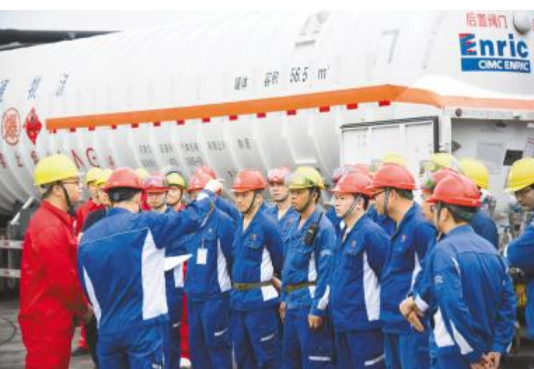
永祥树脂召开 LNG 切换现场会