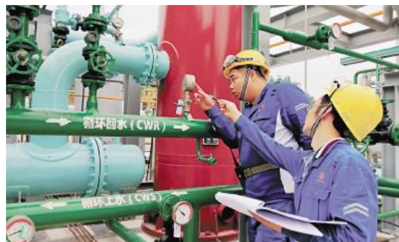
核实每一次的数据记录