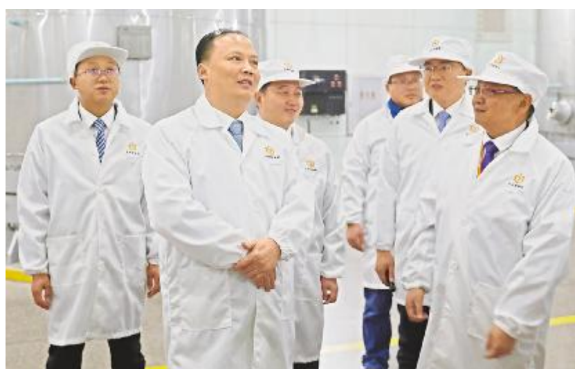
刘汉元主席视察永祥新能源公司