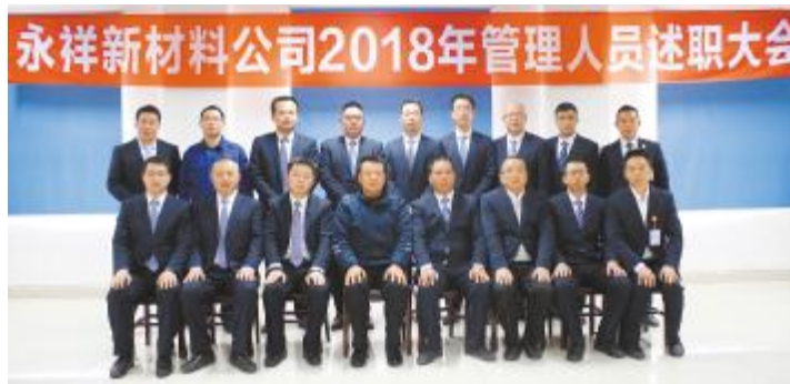
永祥新材料2018年管理人员述职大会成功举行