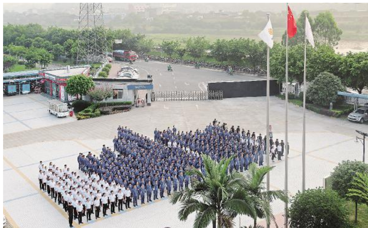
朝气蓬勃的永祥团队

高效经营——提高效率,优化流程,下沉服务。 全面预算管理,有效组织利用资源,致力于工作价值最大化,包括价值采购、价值营销、价值财务等,强化履职尽责,培育工匠明星。各部门体系、全方位发力,促进现有成熟经营公司持续实现突破,新投产公司高效达产达标达效,引领高峰。