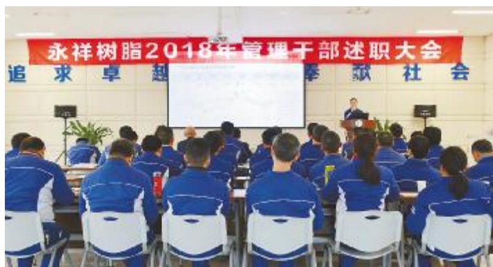
永祥树脂召开2018年管理干部述职大会

迈入2019年第一个月,永祥股份朝气蓬勃,壮志满怀,快速启动新一年的工作。为认真梳理2018年工作,规划2019年各项工作开展,谋定而动。永祥多晶硅、永祥树脂、永祥新材料、永祥硅材料、永祥新能源、内蒙古通威高纯晶硅相继举行了管理干部述职大会,全员上下统一思想,凝心聚力,为新的一年新目标,全力向前!