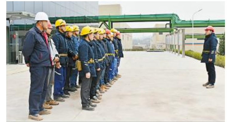
永祥新能源开展节前安全大检查

本报记者 唐黄之 通讯员 潘爱原 何俊 刘召伦 周万江 黄港 周海容 卢小兰 吴旭娇 李国祥 张慧 广洪明 陈玲 许文娟 杨婷