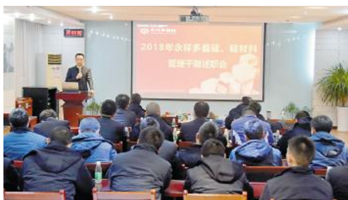
永祥多晶硅召开2018年中层干部年终述职大会