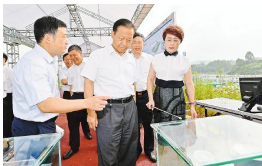
2018年8月17日,四川省委书记彭清华莅临永祥新能源高纯晶硅项目现场调研