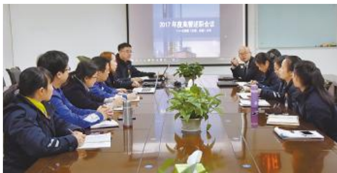
永祥多晶硅各部门迅速召开节后收心会

2月24日,永祥多晶硅品管部开展了“趣味分享,快乐起航”为主题的讲用活动。新年伊始的首次讲用活动中,品管部员积极分享假日中的收获与感悟,并与实际工作联系起来,感悟生活的美好与工作的快乐。活动中,员工感悟到安全是一切工作的前提,在度过一个欢乐的节日后,应尽快收心,理清思路,轻装上阵,恪尽职守,尽快收拾心情,全身心投入到工作之中,用心工作,用智慧工作,全力以赴,努力拼搏,争取在新的一年里突破自我。