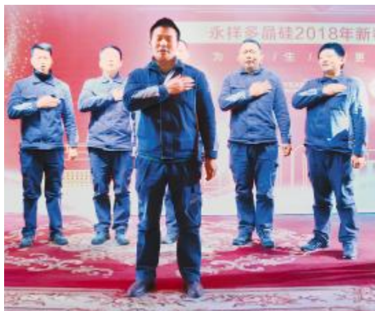
永祥多晶硅团拜会别具特色的“红毯秀”