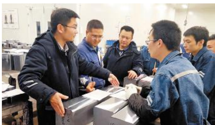
永祥硅材料开展现场硅片质量攻关