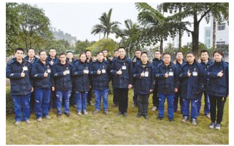
永祥多晶硅冰机公关组