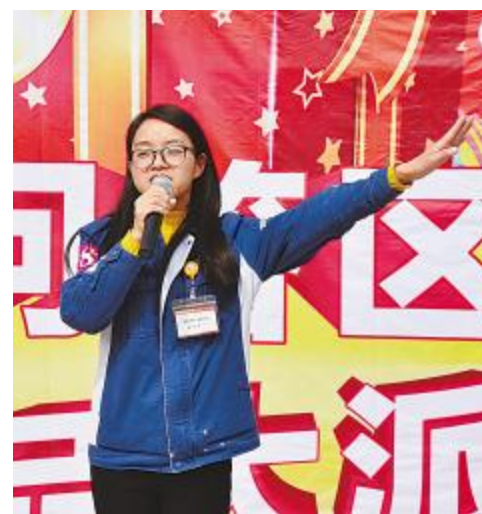
员工积极参与“你问我答”环节