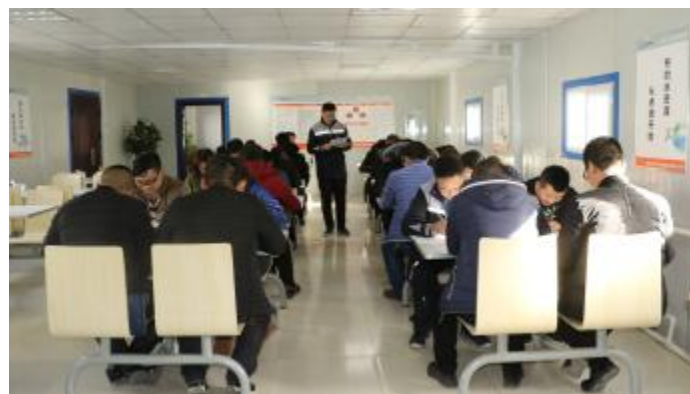
内蒙古通威高纯晶硅开展培训考试