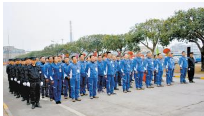
永祥树脂新春后首次升旗仪式现场

2月,内蒙古通威高纯晶硅组织并建立新员工训练营,这是内蒙古通威高纯晶硅在包头进行的第一期新员工培训。此次训练营的课程分为企业文化培训、公司级安全培训和各工段工艺培训。企业文化培训结合拓展训练模式,从破冰分组开始,通过多种形式的团队建设活动凝聚团队,培养默契,营造家庭氛围。公司将企业行为标准融入到培训过程中,设计一系列团队奖惩标准,使新员工很快融入到企业军事化的氛围里。通过对企业文化、公司规章制度、安全知识的学习,新员工们理论考试达到100%通过率。