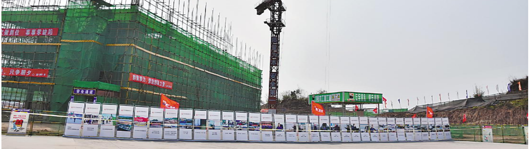
永祥股份乐山5万吨高纯晶硅及配套新能源项目建设现场

本报通讯员 许文娟 孔祥晟 朱静霞 陈俊宇 唐鹏 潘爱原 黄仕建 米茜 刘召伦 李禄华 黄欢 袁红 刘一林 赵东梅 徐继勋 谢琴