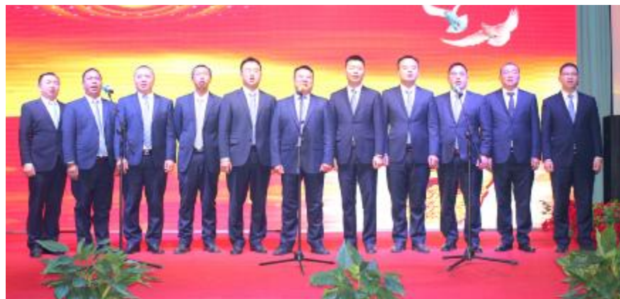
永祥水泥团拜会上,永祥水泥管理团队合唱《团结就是力量》