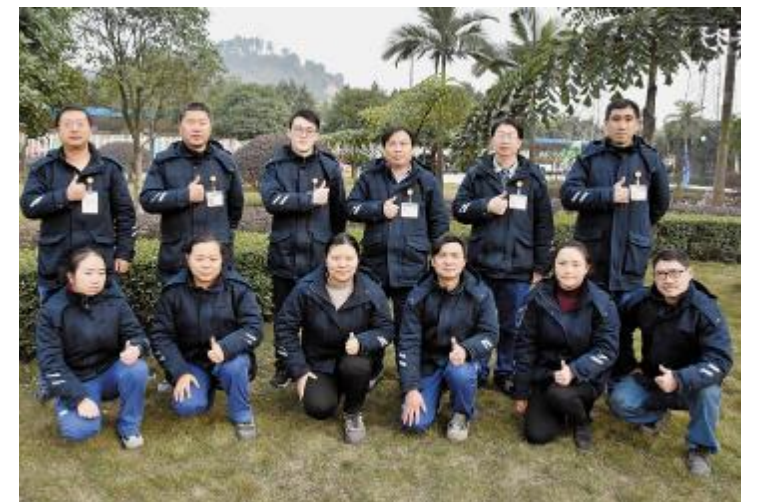
永祥多晶硅空分公关组