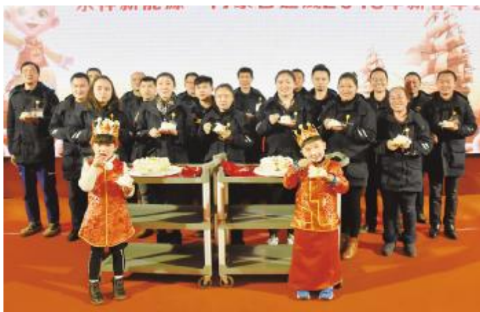
永祥新能源、内蒙古通威高纯晶硅联合举行团拜会