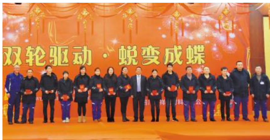
永祥硅材料团拜会上,公司为“2017年度优秀员工”颁奖