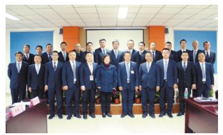
永祥水泥管理班子